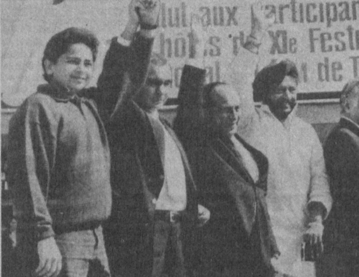
Участники XI ТМКФ.