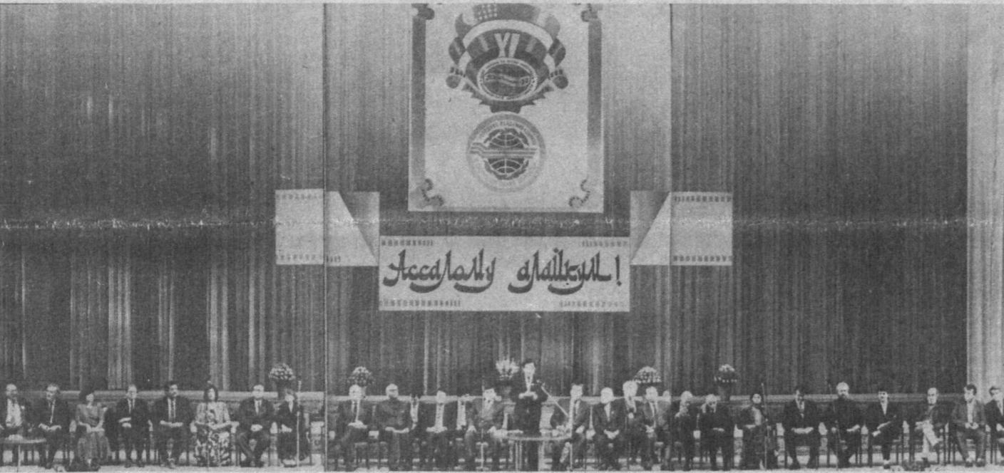
НА СНИМКЕ: торжественное открытие XI ТМКФ во Дворце дружбы народов.