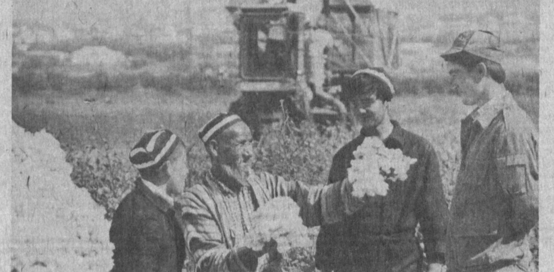
СУРХАНДАРЬИНСКАЯ ОБЛАСТЬ. Высокие темпы уборки отличают нынешнюю страду в колхозе имени Н. Баймуратова Джаркурганского района. Земледельцы наметили получить с хлопковых плантаций 4,560 тонн сырья.