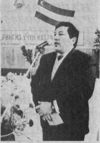
ЭТО был грандиозный хашар. Проходил он без помпы и показухи. Работали буквально день и ночь. Никто не жаловался на переутомление, усталость. Понимали, что участвуют в святом деле. Вель в стенах детского дома будут жить сироты, чья жизнь и без того полна лишений, и пусть они почувствуют настоящее человеческое тепло и заботу.

дом изменил свой облик, и сбылась мечта мальчишек и девочек: теперь им созданы все условия для интересной, увлекательной жизни. Волшебство же это совершили вполне реальные люди и тети из десятков предприятий и организаций. Они внесли свои сбережения, другие выделили средства из доходов, заработанных трудовыми коллективами. Словом, помогали, как