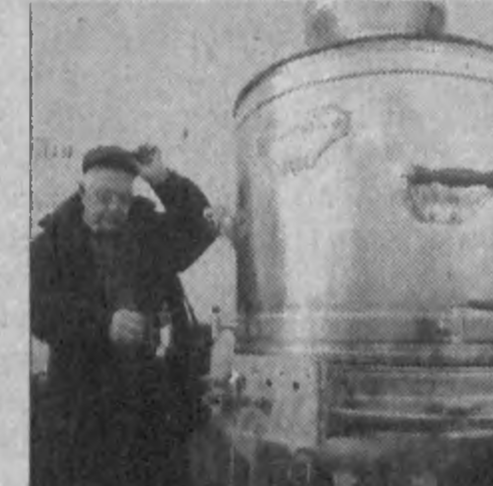
Чайку извоните? Из самовара высотой 1,75 метра можно налить 295 литров.

В настоящее время государства используют запасы золота прежде всего для регулирования курса национальной валюты. В зависимости от того, нужно ли ее укрепить или ослабить, центробанк покупает или продает золото на открытом рынке.