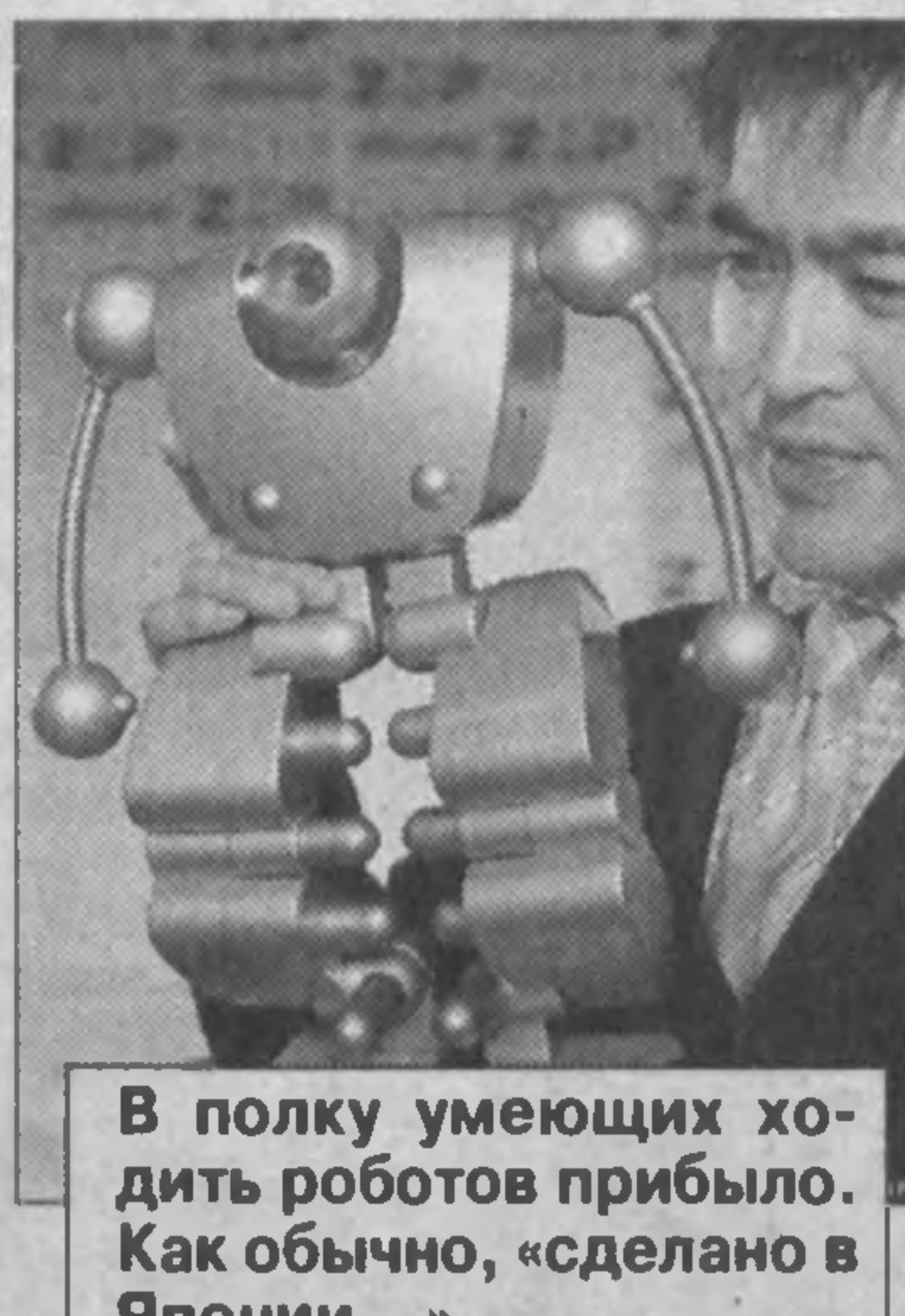
В полку умеющих ходить роботов прибыло. Как обычно, «сделано в Японии...»