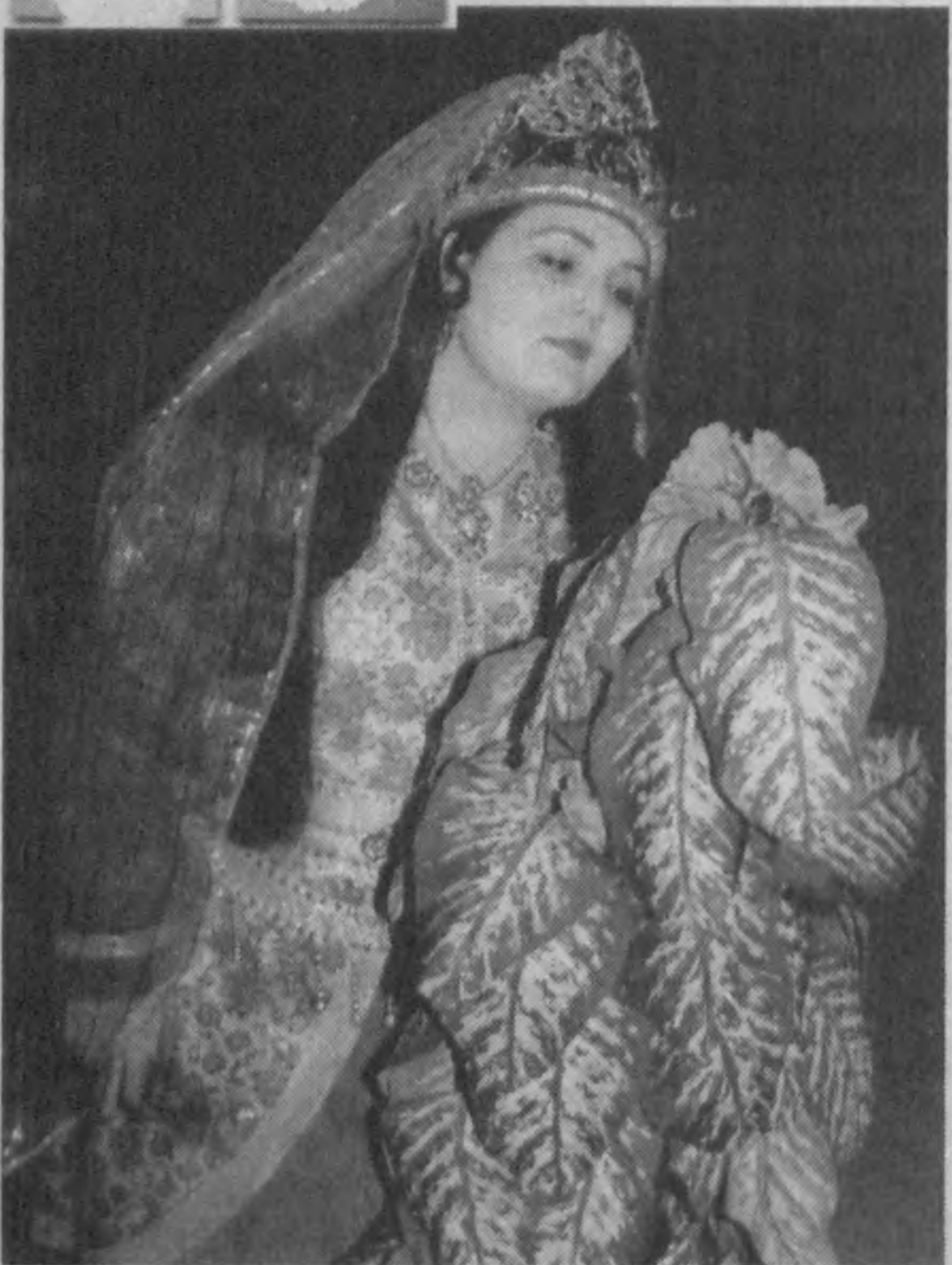
Народная артистка Узбекистана Муссар Раззакова.

Чудо оперного искусства неизменно волнует зрителя своими трепетными образами и возвышенностью чувств. Ведь в нем причудливо сочетаются гармония музыки и слова, обладающих огромной силой воздействия. Счастливая возможность окунуться в этот мир, где властвует вдохновение и творчество, получат вскоре столичные ценители классики, которым предстоит встреча с яркими звездами мировой оперной сцены — блистательными солистами Большого театра России, лауреатами международных конкурсов вокалистов Еленой Образцовой и Зурабом Соткилавы.