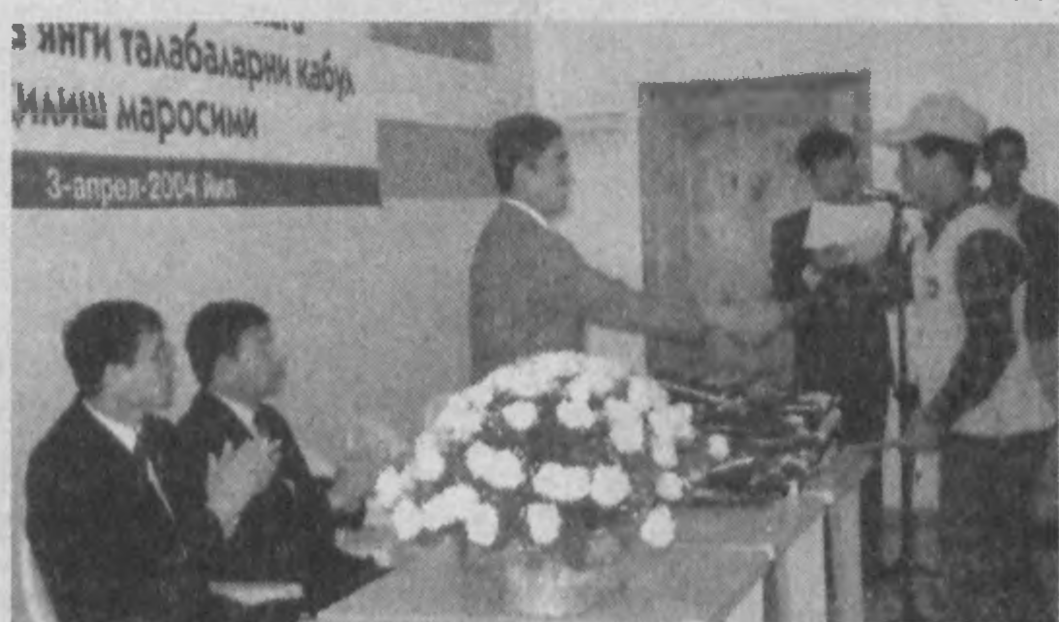
Чествование первых выпускников.

Ровно год назад в горном поселке Кумушкан Паркентского района столичной области открылся узбекско-корейский Центр по подготовке специалистов сельского хозяйства. На днях здесь чествовали первых выпускников и представляли тех, кто вошел во вторую группу обучающихся.