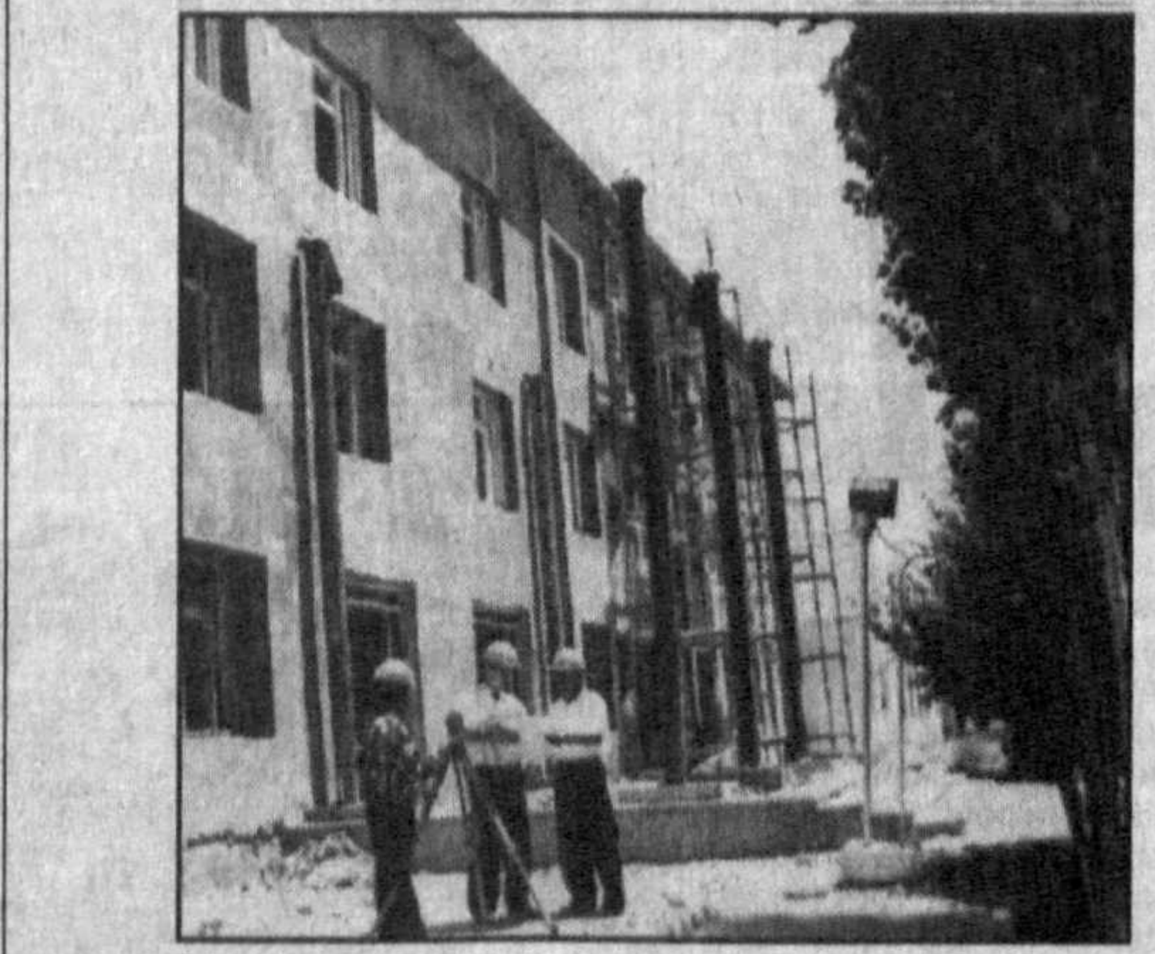
На СНИМКАХ: семейная бригада — Акмаль, Маннон и Шухрат Ахмедовы; идут ремонтные работы.