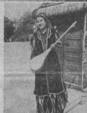
[Материалы, посвященные юбилею Нукуса, читайте на 3-й странице].

стан Почетной грамотой Республики Узбекистан. Президент Республики Узбекистан И. КАРИМОВ. город Ташкент, 12 декабря 1992 г.