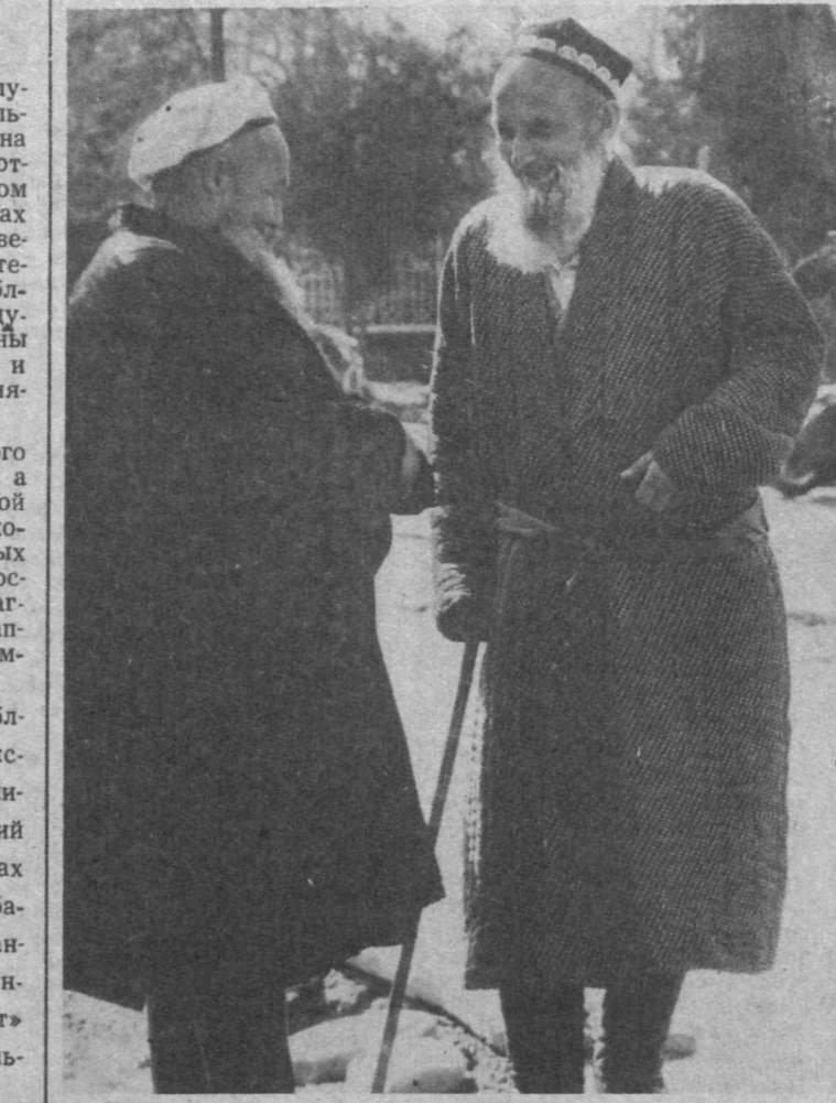
Дорогие мои старики...

Сказала при встрече с артистами президент СТУД Б. Кариева, — оно облекает людей разных национальностей и верований, налаживает дружеские отношения, благодаря ему укрепляется международный авторитет суверенной республики. Дальнейшие связи с «Табани» корпорацией позволяют расширить географию наших гастролей, а значит, выполнять творческую программу во имя обогащения культуры.