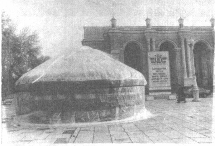
Қорақалпоқ ўтовни пойтахтимизга жуда ярашди.