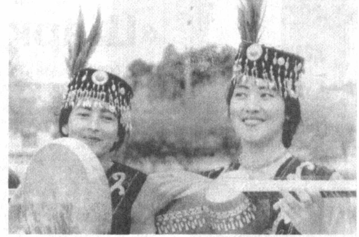
Ўзбекининг «Лазги»сини кўйлайман

— Туман марказларида жойлашган машина-трактор парклари амалда уларни монополистларга тутиб, хизматлари эвазига жуда юқори тўлов шартларини қўйиб, қишлоқ хўжалиги корхоналарини анча нуқдлай аҳволга солиб қўймоқдалар. Масалан, Қорақалпоғис-