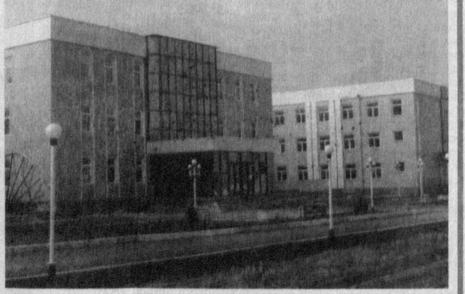
Шундай гўзал коллеж биносиди таълим олаётган ёшларга ҳар қанча ҳавас қилса арзийди.