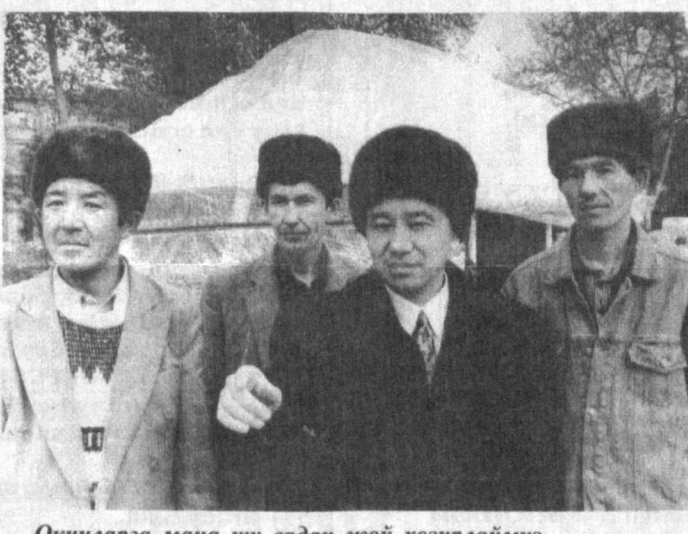
Оқилларга мана шу ердан жўй ҳозирлаймиз.

кенглиги, табиий қўллар, пичанзорларнинг қўллиги ва ҳоказоларини) ҳисобга олган ҳолда, бу ерда ровоқчилик соҳасини янада ривожлантиришга кўпроқ эътибор берилиши лозим, деб ўйлаймиз. Мабоодо, биз ҳосилдорлиги паст шимолӣ ҳудудга жойлашган қишлоқ хўжалиги корхоналарида эм-хашак ва озуқа экинлари майдонини кенгайтираёқ, Қорақалпоғистоннинг яна эмас, балки бошқа вилоятларини ҳам балиқ ва гўшт маҳсулотлари