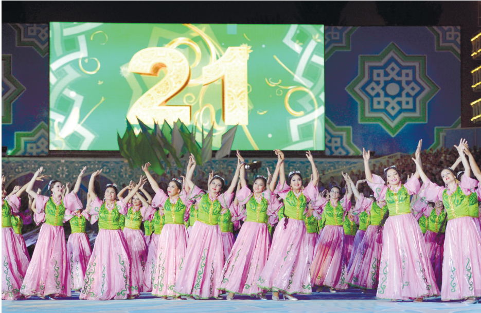
(Давоми. Боши 1-бетда).

Бинобарин, бу сана Ўзбекистон тарихида, миллатимизнинг истиқболда муҳим тарихий аҳамият касб этади.