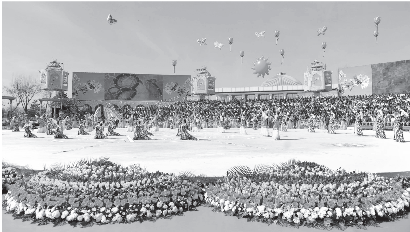
◀ (Давоми. Бошланиш 1-бетда).

Наврўз — миллатлараро аҳиллик ва бирдамликка, ўзаро ҳамкорликка, ҳамжиҳатликка чорловчи айём. Чунки унда тинч ва осойишта ҳаёт қадри, муруват, саховат, яхшилик, эъзоз ва эҳтиром мазмуни мужассам.