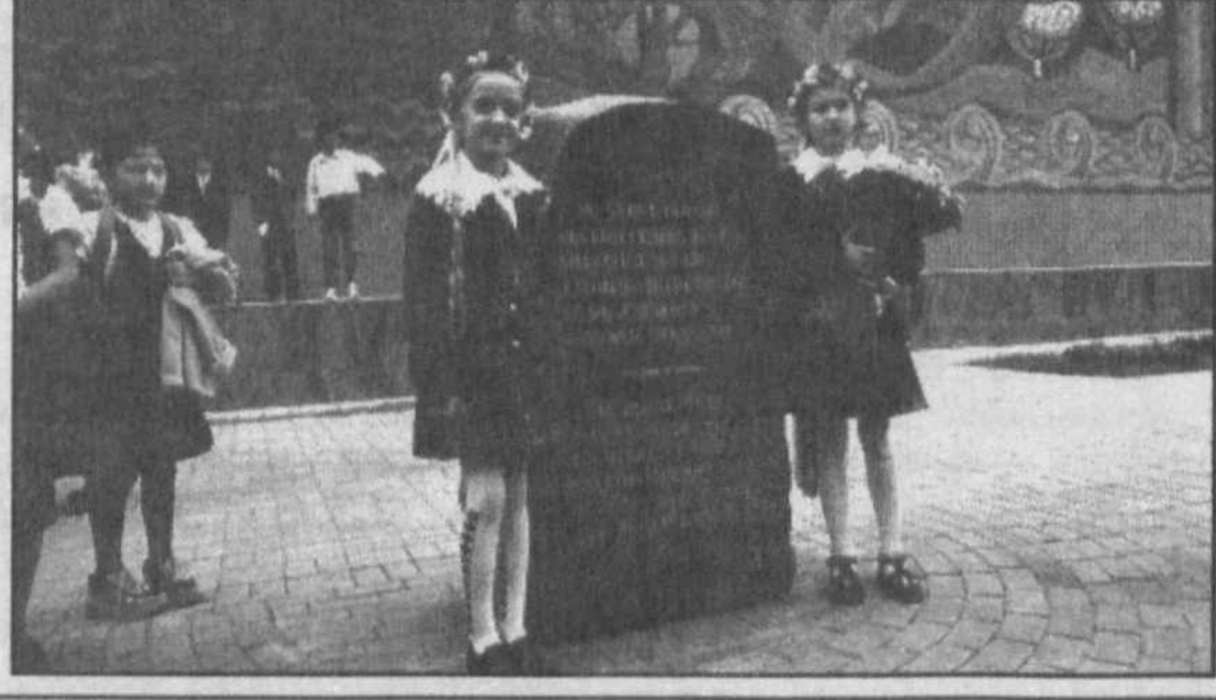
НА СНИМКЕ: во время закладки первого камня в основание памятнику Т. Шевченко.

Живя здесь, в родном Узбекистане, мы, представители национально-культурных объединений, в частности, украинцы, имеем возможность укреплять наши связи с этнической Родиной.