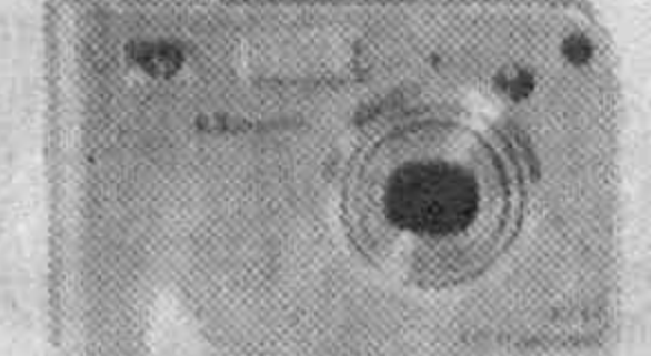
HP PHOTOSMART R717