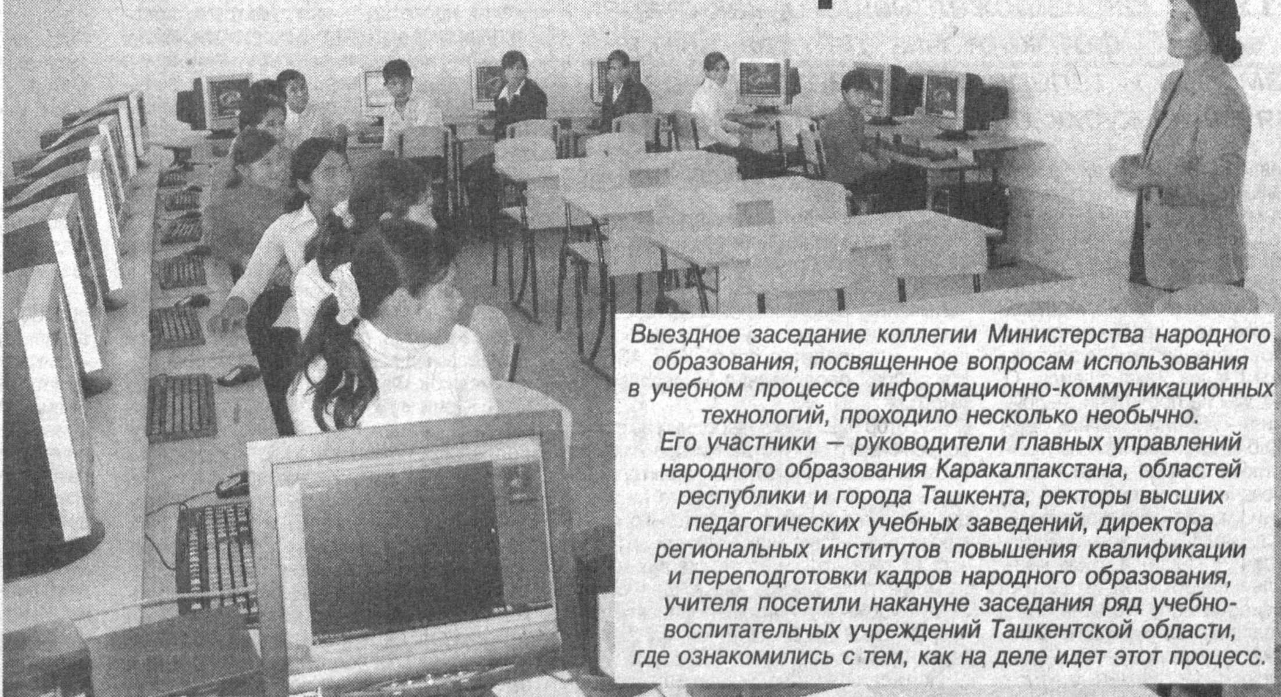
Выездное заседание коллегии Министерства народного образования, посвященное вопросам использования в учебном процессе информационно-коммуникационных технологий, прошло несколько необычно. Его участники — руководители главных управлений народного образования Каракалпакстана, областей республики и города Ташкента, ректоры высших педагогических учебных заведений, директора региональных институтов повышения квалификации и переподготовки кадров народного образования, учителя посетили накануне заседания ряд учебно-воспитательных учреждений Ташкентской области, где ознакомились с тем, как на деле идет этот процесс.