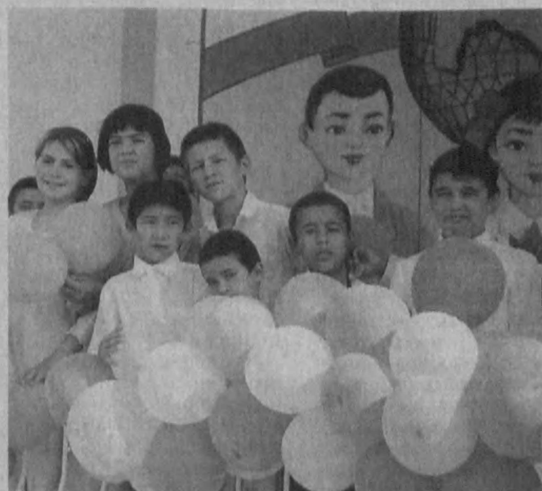
Воспитанники Наманганского дома милосердия № 26

Направленная на укрепление дружбы, межнационального согласия и взаимопонимания, воспитание в сознании наших людей, особенно молодежи, чувства любви и сострадания к одиночкам, нуждающимся в посторонней помощи, инвалидам и больным, усиление поддержки социально уязвимых слоев населения, координацию всей проводимой в этих направлениях работы, программа в равной мере возлагает большие и ответственные задачи на многие организации и структуры. Это можно увидеть на примере Наманганской области.