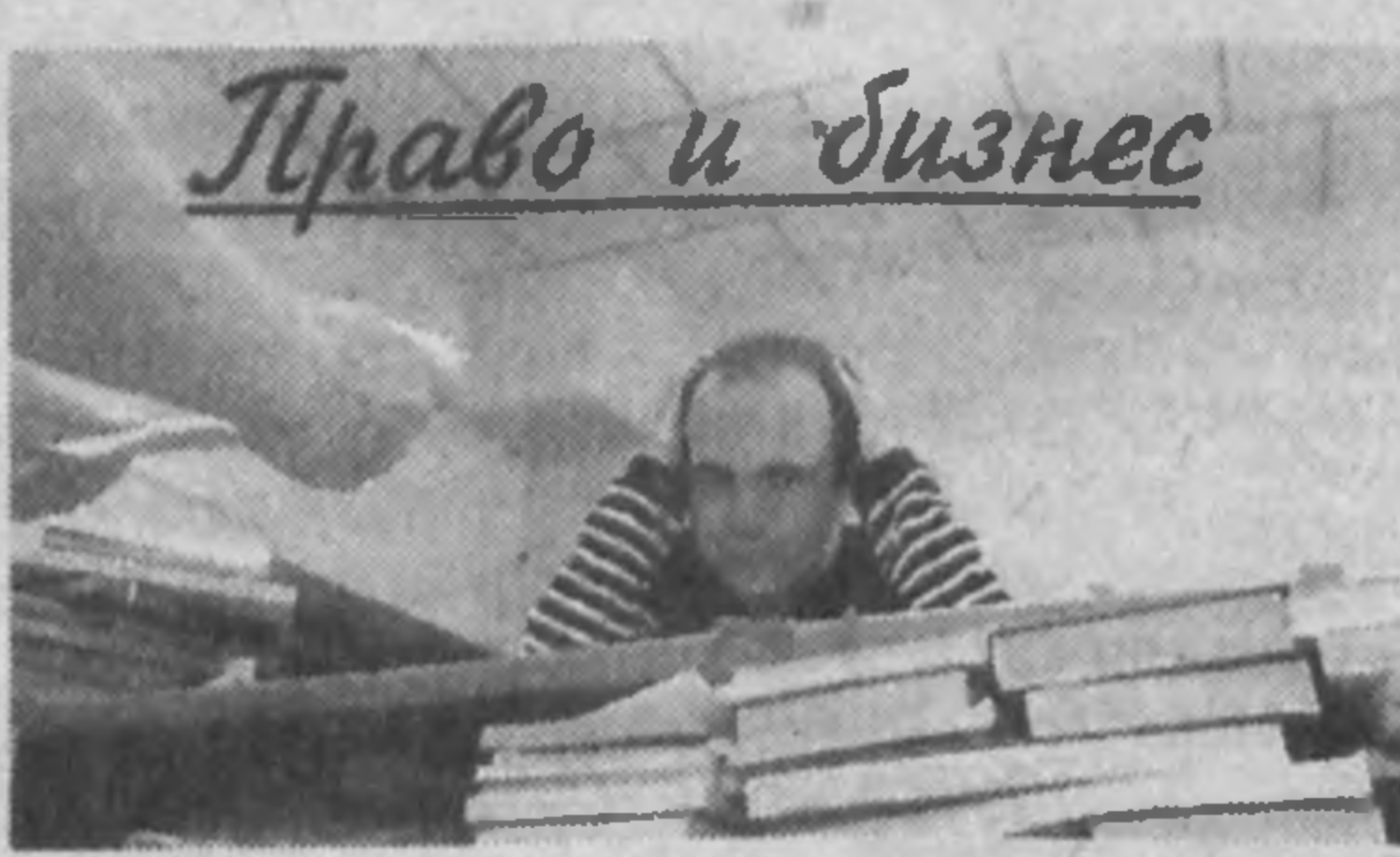
не исполняет взятых на себя обязательств. Есть ли у нас какие-либо возможности заставить его отвечать за нарушение договора?"

Если в ответе о признании претензии не содержится перечень признанной суммы, заявитель претензии вправе по истечении двадцати дней после получения ответа предъявить в учреждение банка распоряжение на списание в беспорядочном порядке признанной должником суммы. К распоряжению прилагается ответ должника. И как следствие нарушения данного порядка, у вас возникает право подачи в суд заявления на выдачу судебного приказа. Так, в случае получения отказа (частичного отказа) или неполучения ответа на претензию в установленный срок, а также без предъявления претензии по хозяйственным договорам вы можете подать в хозяйственный суд исковое заявление и заявление на получение су-