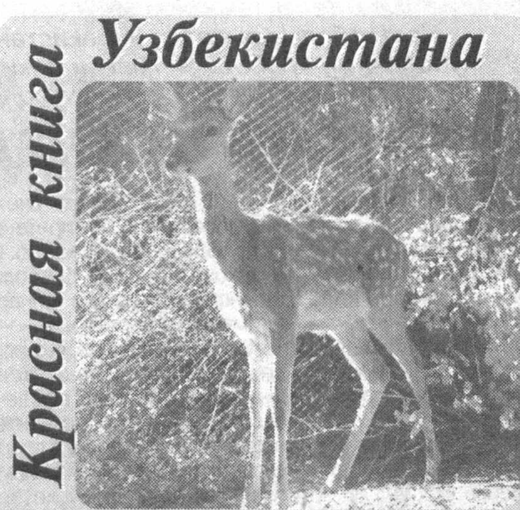
Красная книга Узбекистана Сегодня в вольерах Зарафшанского заповедника содержатся 24 оленя.

300 — в искусственно созданных группировках. Затем произошло катастрофическое падение численности оленей. Это привело к тому, что среднее течение Амударьи оказалось почти единственным местом, где сохранились естественные популяции бухарского оленя.