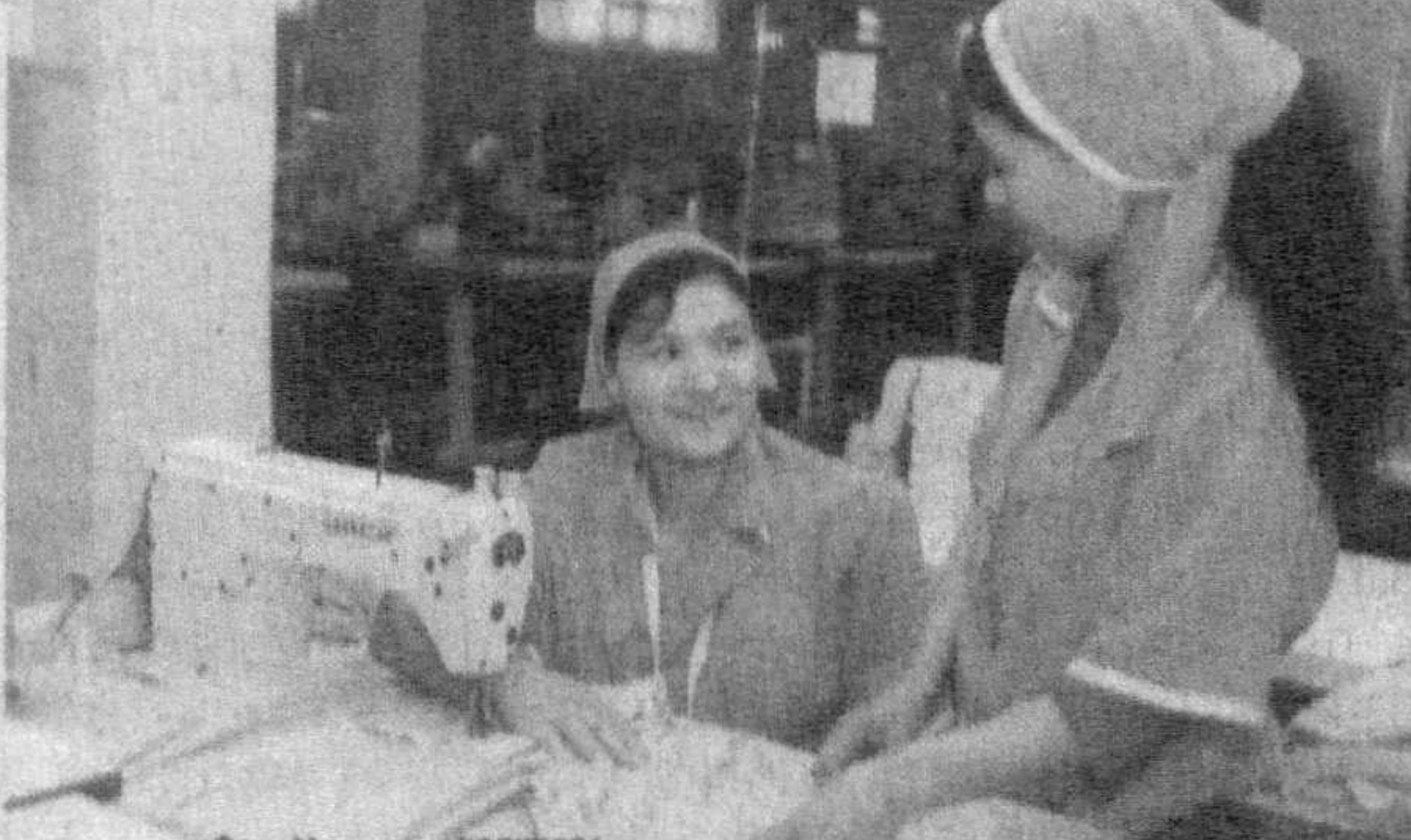
Фото Министр КОИДЗУМИ.

Ключевыми направлениями развития экономики являются модернизация, технологическое и технологическое перевооружение производства.