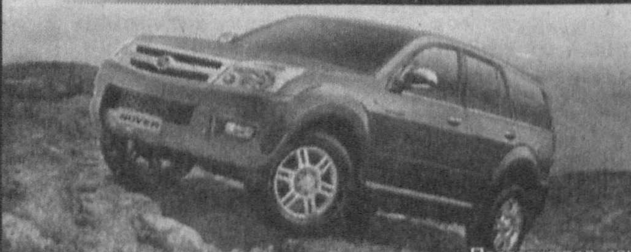
—Поставка под заказ

www.hover.uz e-mail: cent@cent.ars.uz Тел.: 152-66-95, 187-56-46.