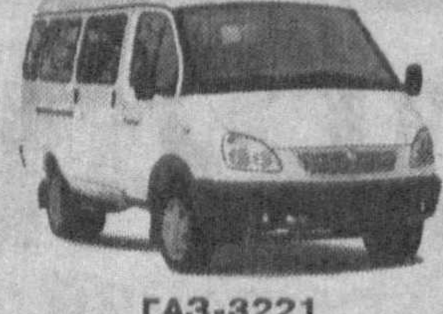
GAZ-3221 Микроавтобус количество пассажирских мест - 15