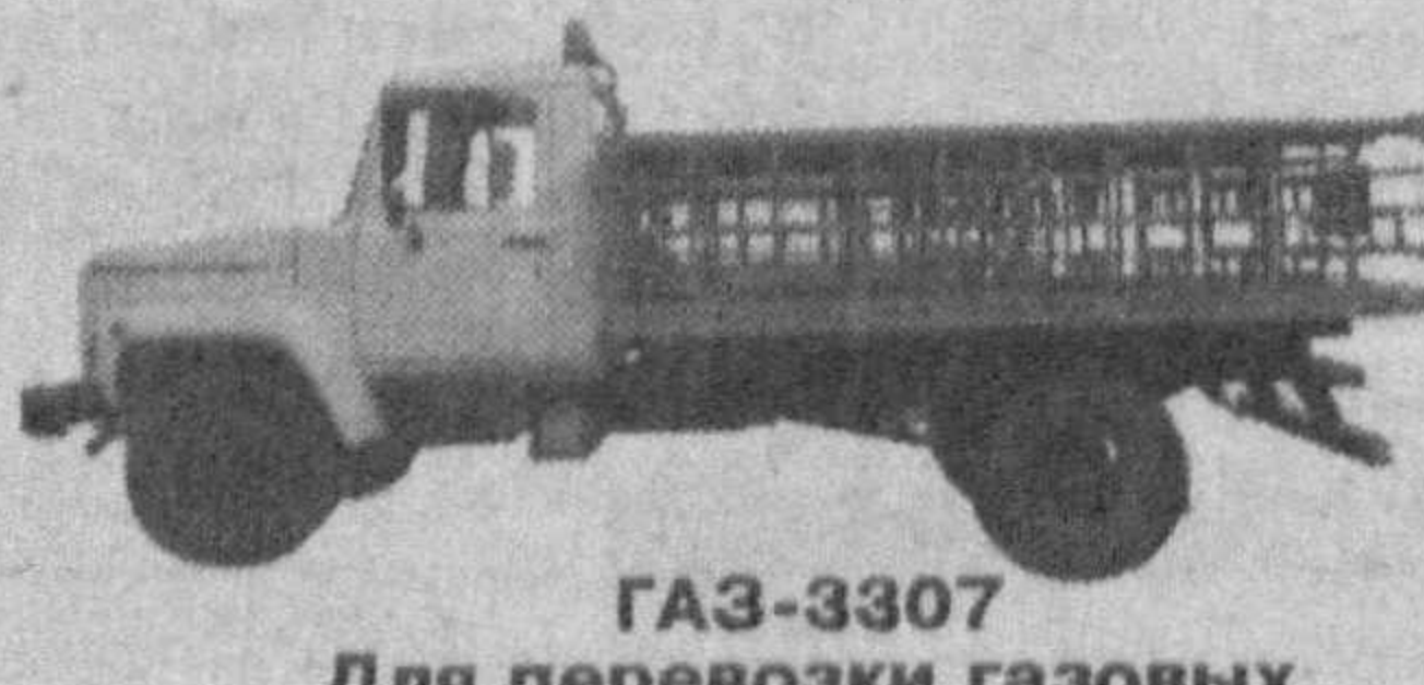
GAZ-3307 Для перевозки газовых баллонов (40 шт.)