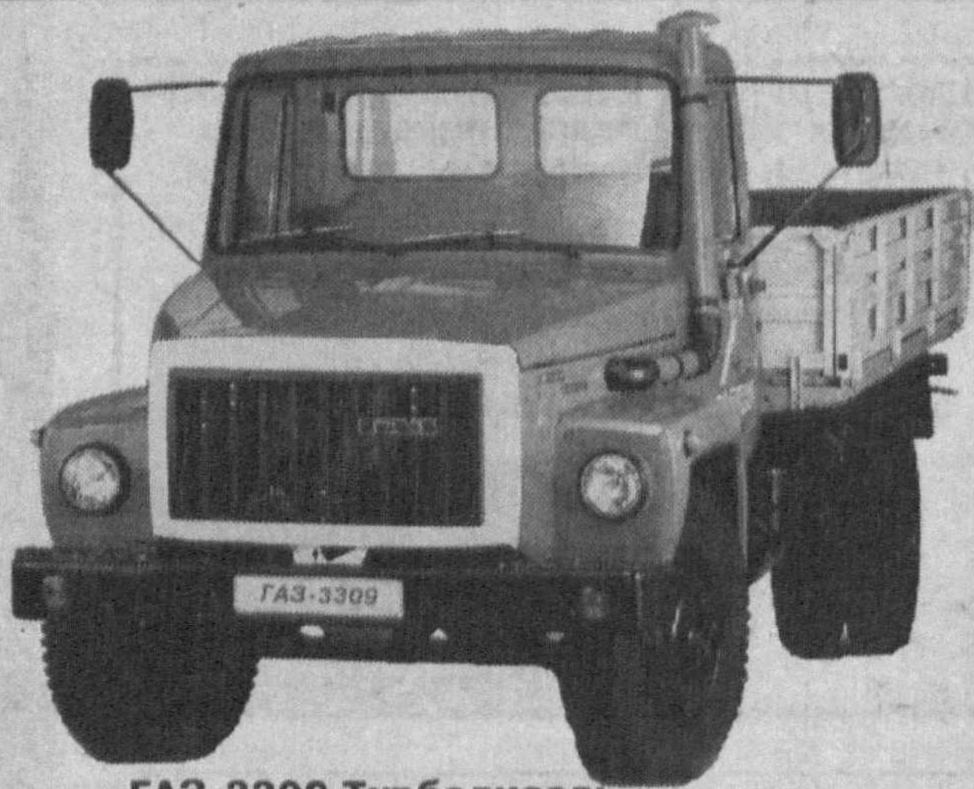
GAZ-3309 Турбодизель грузоподъемность - 4,5 т, количество мест - 2

Республика Узбекистан, 700015, г. Ташкент, ул. Шахрисабз, 18а. Тел./факс: (998-71) 132-12-01, 132-10-36, 132-03-62. Телефоны горячей линии: 126-12-94, 126-26-42.