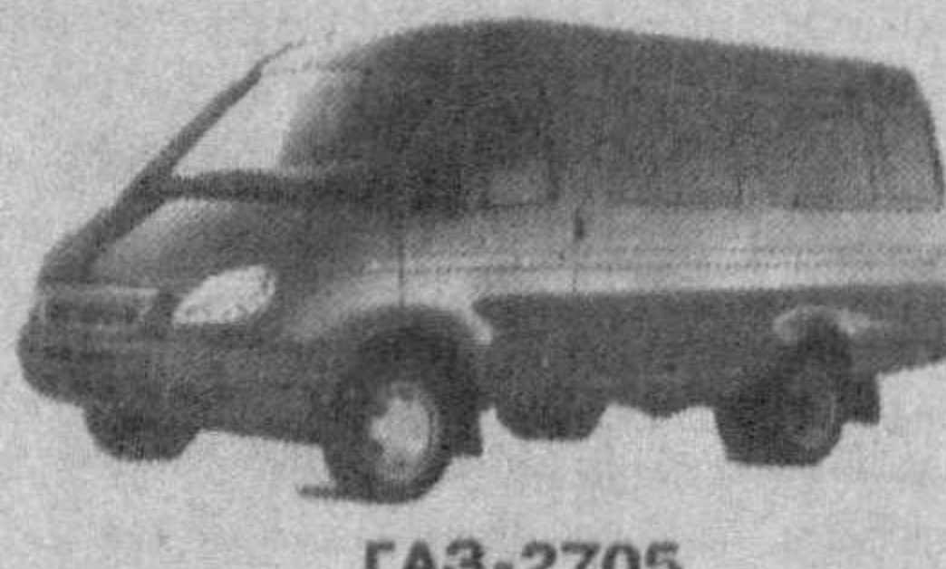
GAZ-2705 Цельнометаллический фургон грузоподъемность - 1,3 т, количество мест - 3 или 7