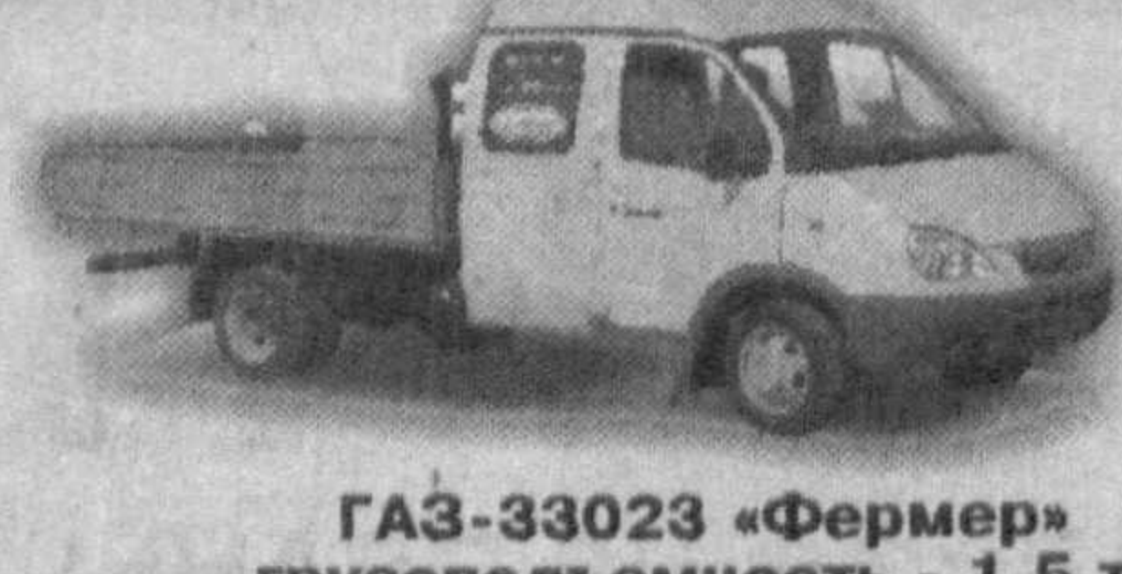
GAZ-33023 «Фермер» грузоподъемность - 1,5 т, количество мест - 6