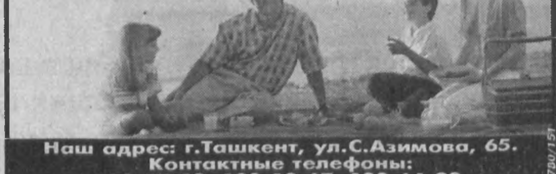
Наш адрес: г.Ташкент, ул.С.Азимова, 65. Контактные телефоны: 133-55-18, 132-13-67, 133-64-92.

Для резидентов Республики Узбекистан предусмотрены 20% скидки в зимне-весенний период.