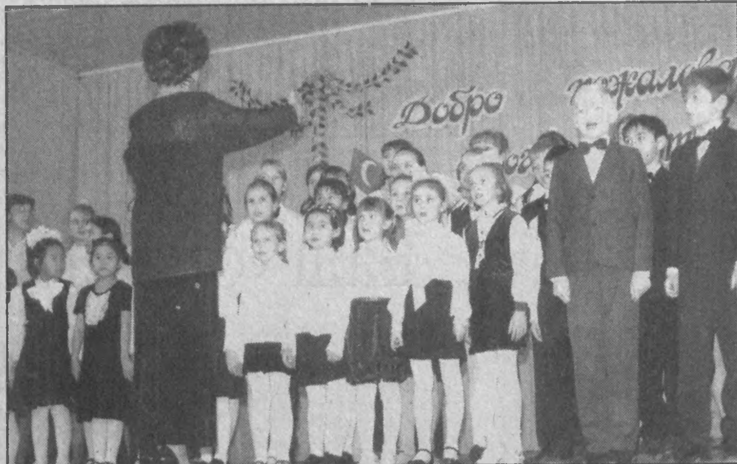
НА СНИМКЕ: на сцене — юные дарования.

Детская оперно-балетная студия при театре имени Алишера Навои существует всего пять лет. Сегодня этот творческий коллектив по праву можно назвать уникальным. Ребятишки поют на восьми языках мира: узбекском, русском, татарском, английском, немецком, японском, итальянском, иврите. Репертуар обширный, включает песни народов мира, джазовые и астрадные номера, оперный блок. Ко всему, дети танцуют и участвуют в различных спектаклях.