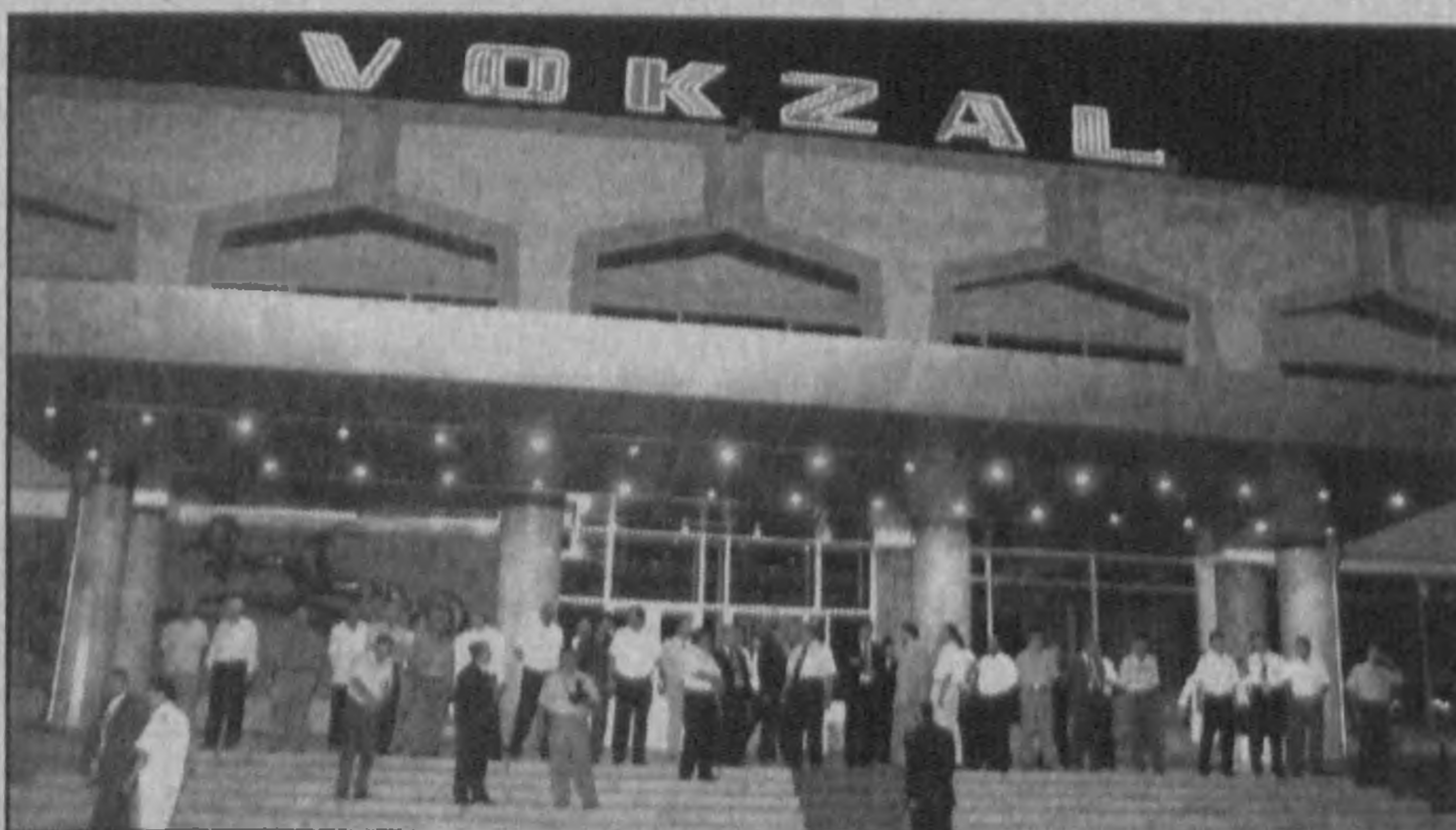
НА СНИМКЕ: обновленный железнодорожный вокзал в Нукусе.