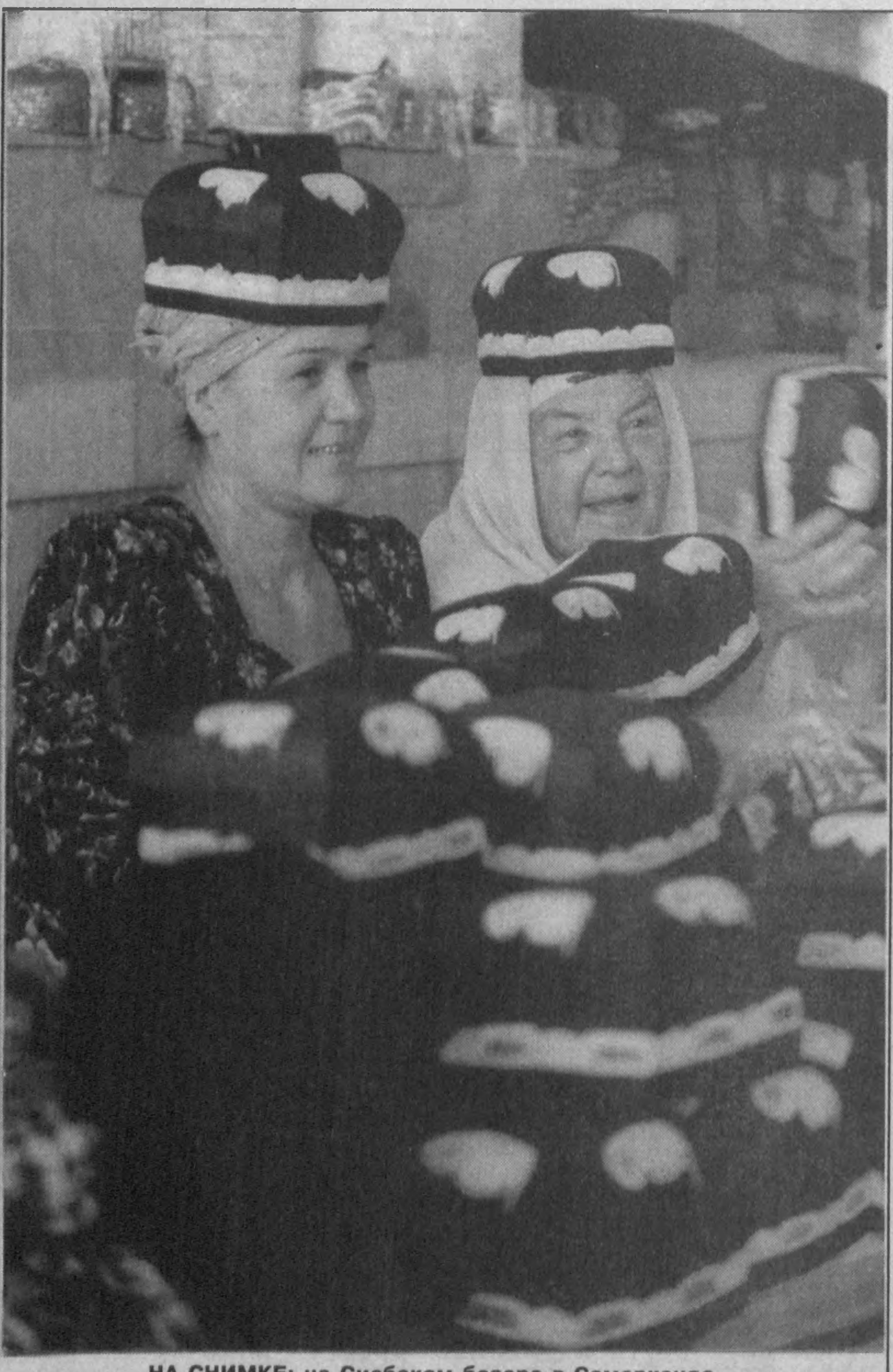
НА СНИМКЕ: на Сиабском базаре в Самарканде.