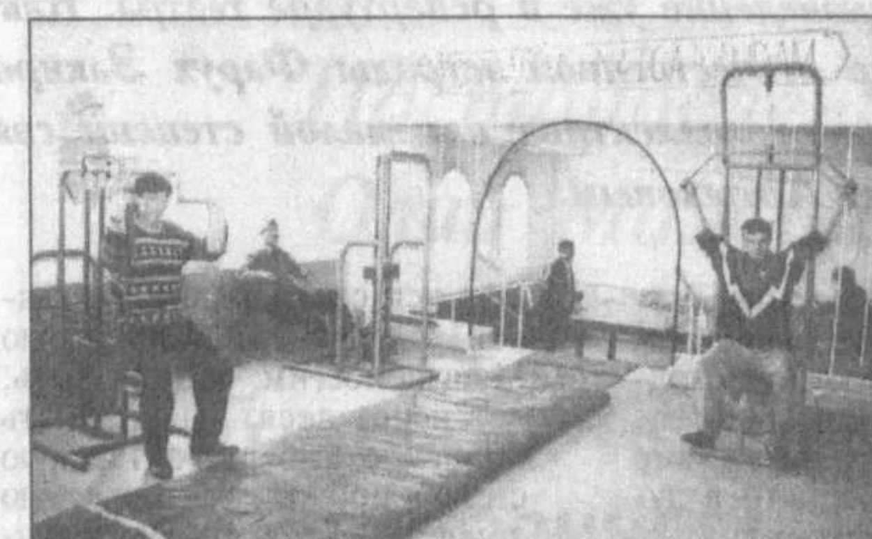
НА СНИМКЕ: в тренажерном зале спорткомплекса автопредприятия.