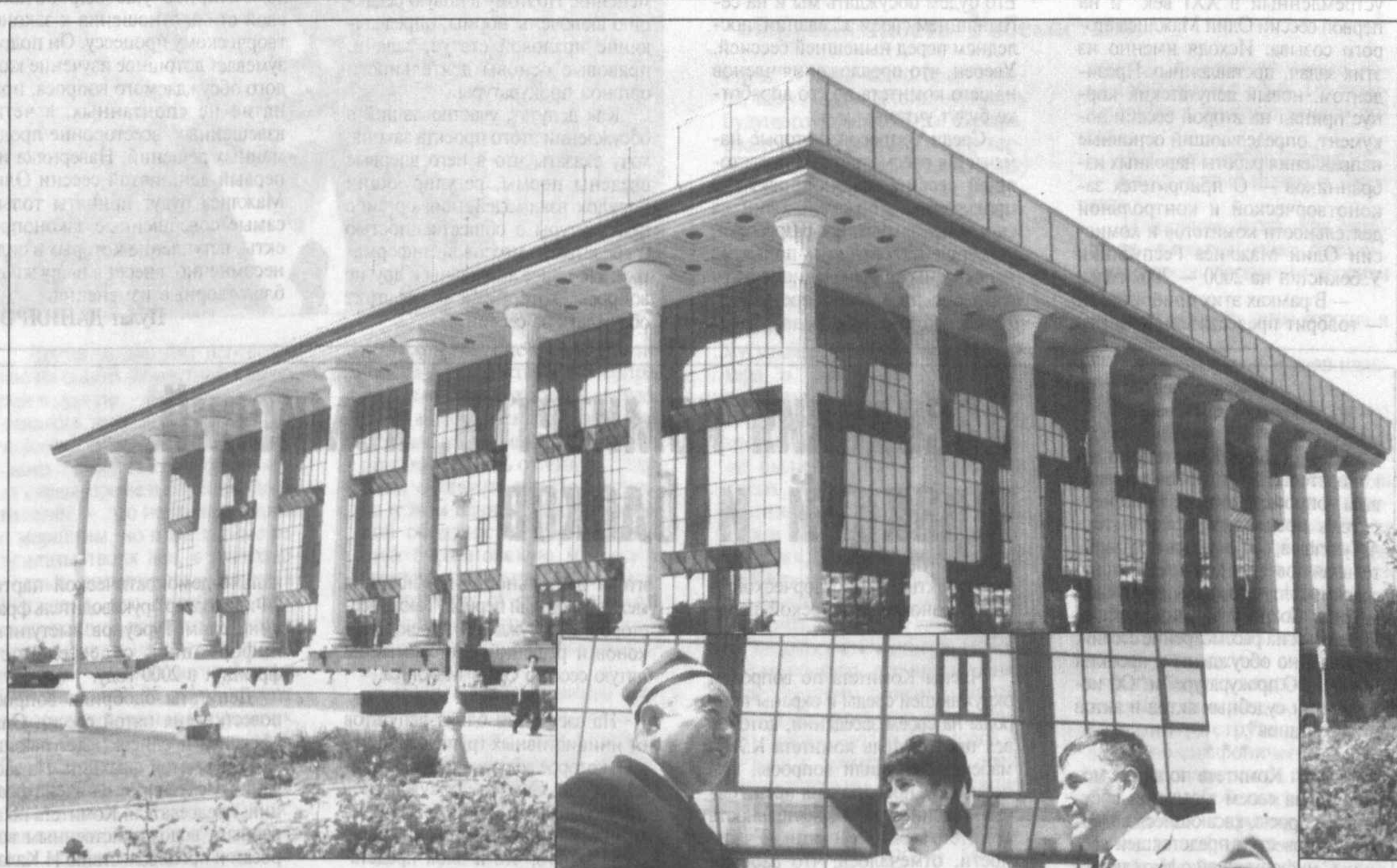
На рассмотрении сессии предполагается внести ряд наиболее актуальных вопросов жизни нашего государства, имеющих огромное значение для дальнейшего реформирования общества, повышения благосостояния народа.

11 МАЯ • ПЯТНИЦА № 92 (2652) • 2001 год В разницу — цена свободная