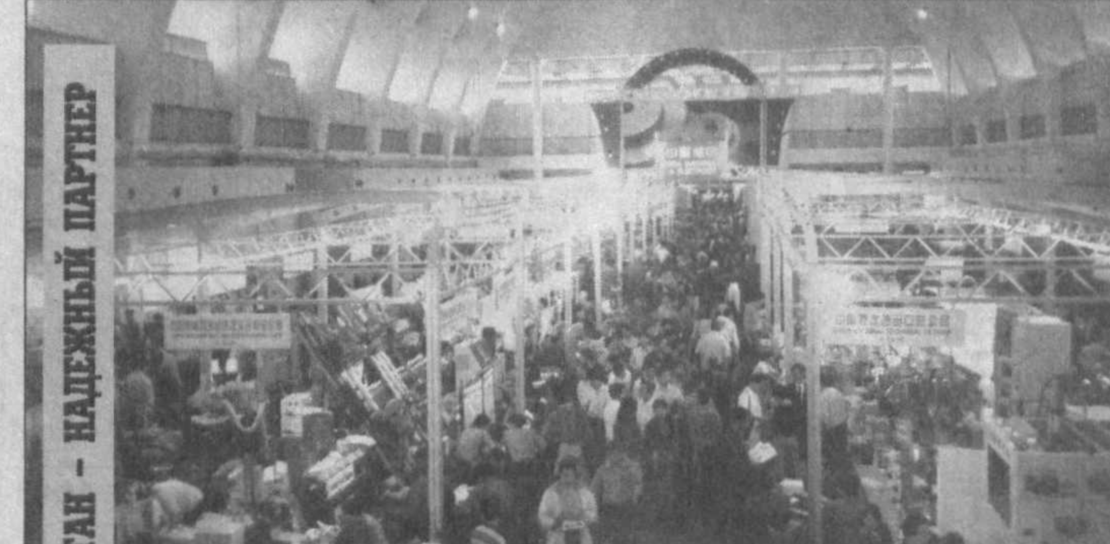
Именно с таким заголовком вышла статья в китайской газете "Beijing daily", посвященная участию совместного предприятия "Узбекская ярмарка" в 89-й международной выставке экспор-тных товаров в городе Гуанчжоу.

Пуллат ХАМДАМ, соб. корр. "Народного слова". Наманганская область.