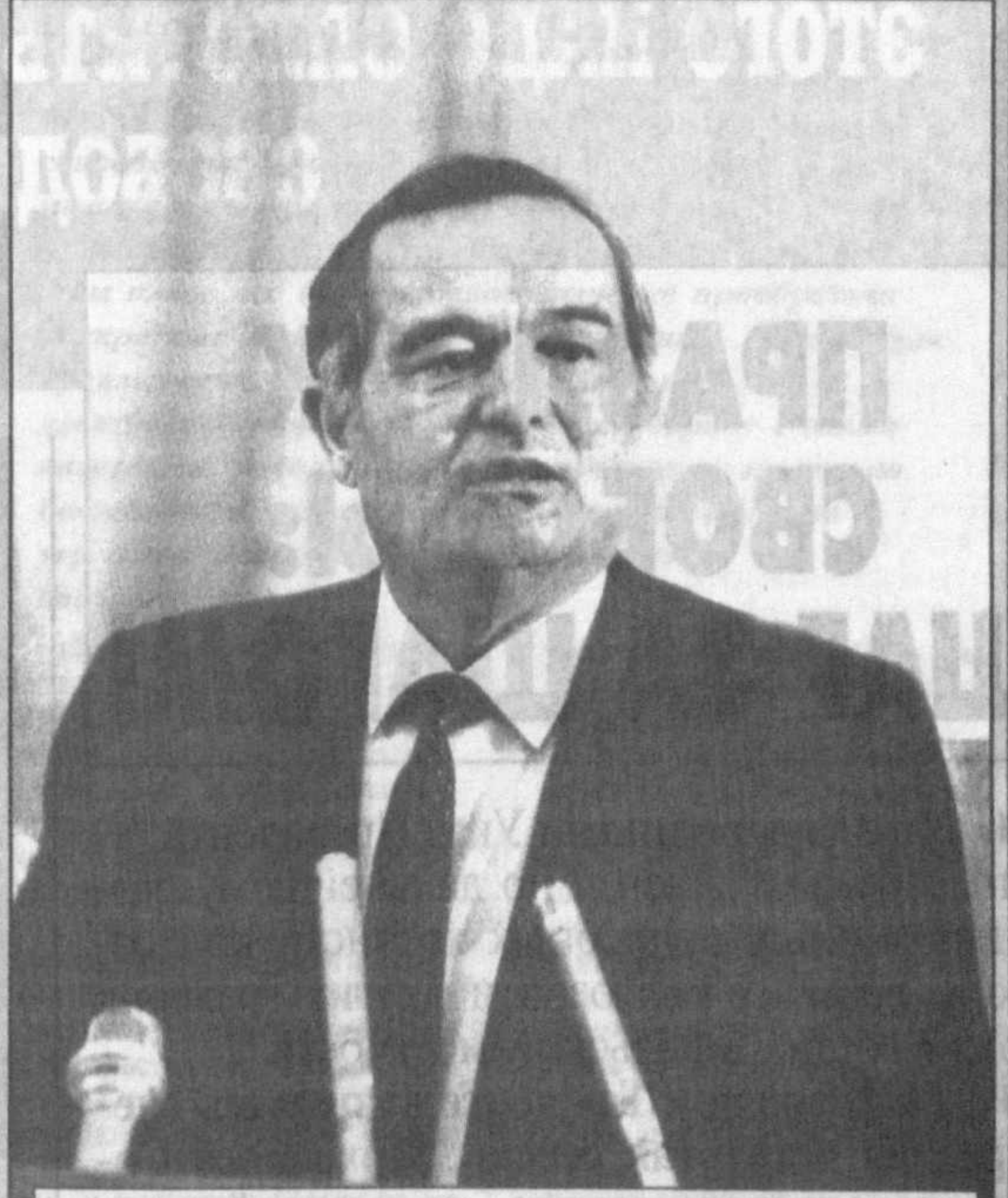
31 августа 1991 года. Лидер нашей страны Ислам Каримов провозглашает независимость Республики Узбекистан.

Сегодня мы начинаем публикацию серии материалов, посвященных десятилетней истории нашего молодого независимого государства