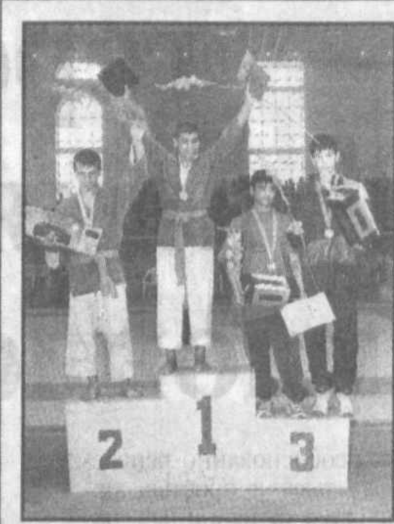
Проведение финала турнира в Термезе имеет символическое значение. Этот оазис издревле является краем известных палванов.

Новизна системы организации массового спорта в непрерывном образовании состоит в том, что одному поколению с самого детства прививается привычка к занятиям физической культурой и спортом.