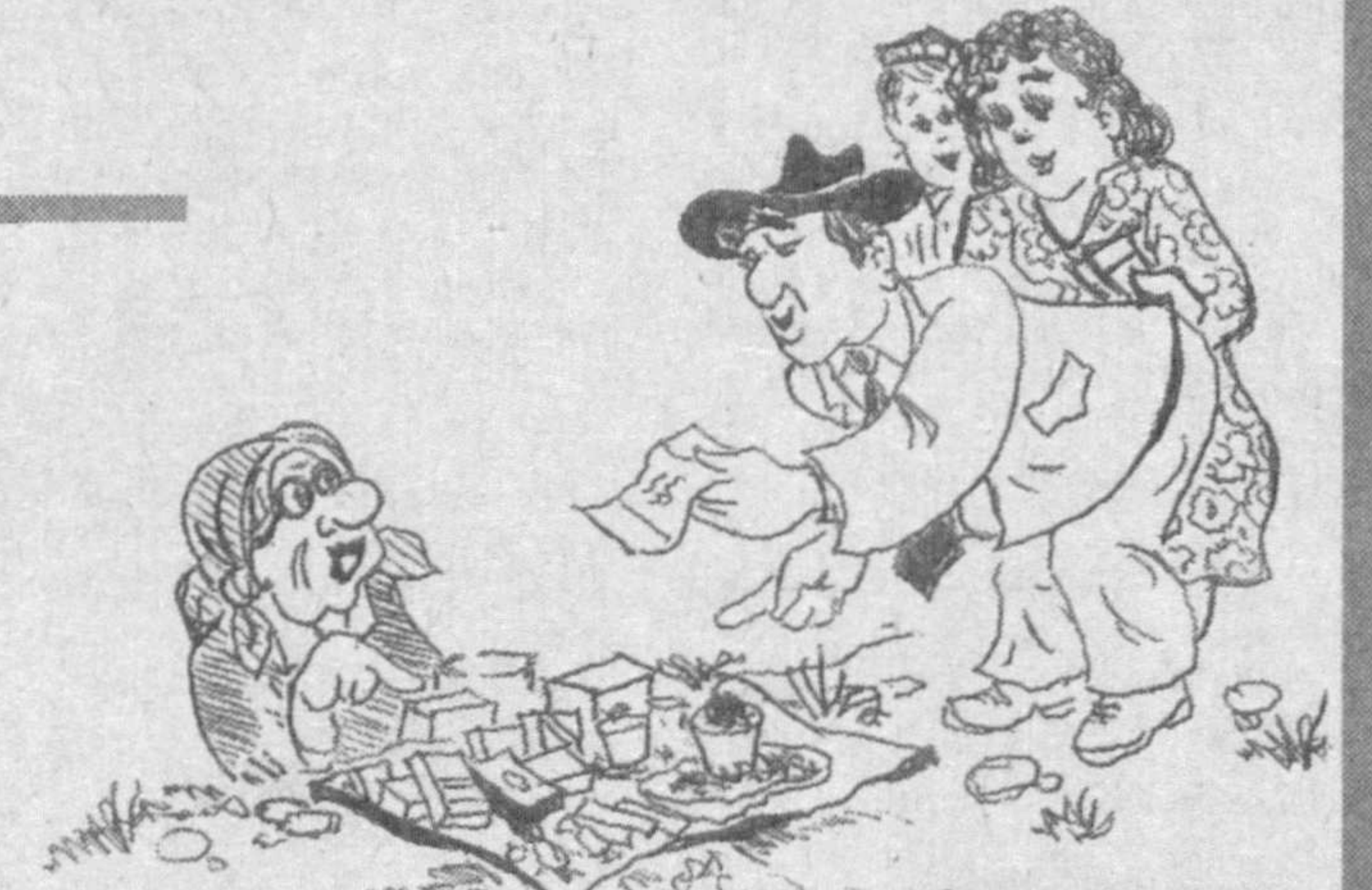
Рис. Аброра ОРИПОВА.

Теневая экономика — это получение прибыли незаконным способом. Данная проблема присуща не только странам с переходным периодом, но и тем, которые считаются развитыми, потому что и в них находятся люди, желающие быстро обогатиться, не считаясь с законами. Их не останавливает страх, так как, ступая на скользкий путь криминала, они думают только о барышах.