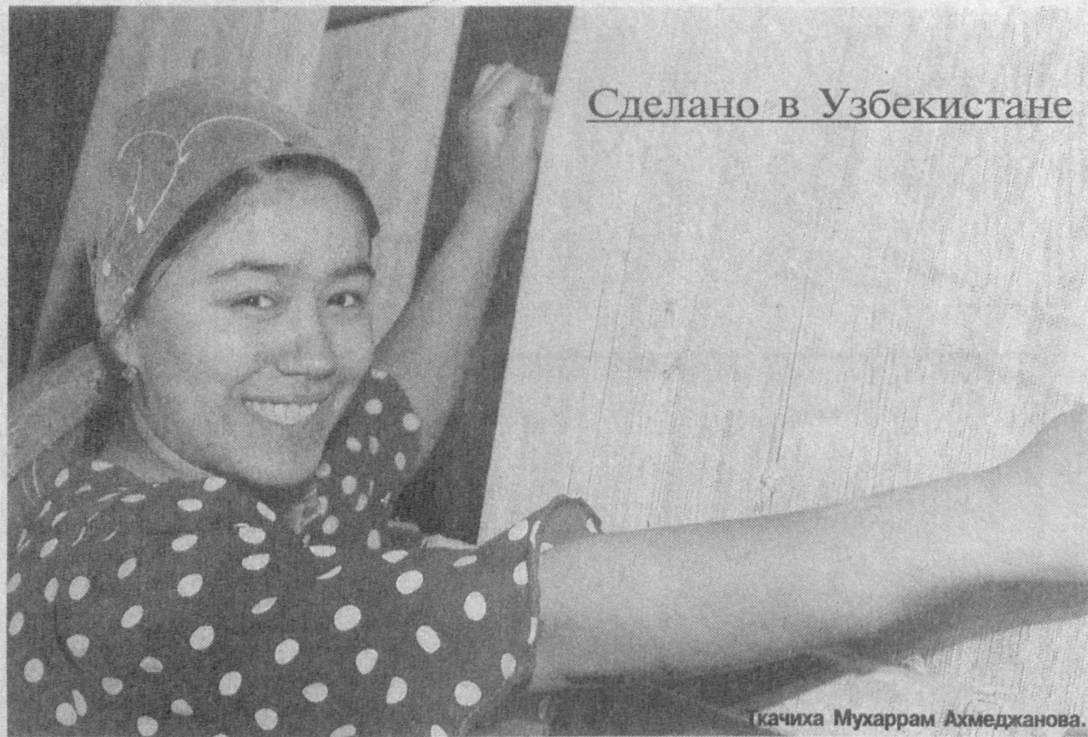
Сделано в Узбекистане