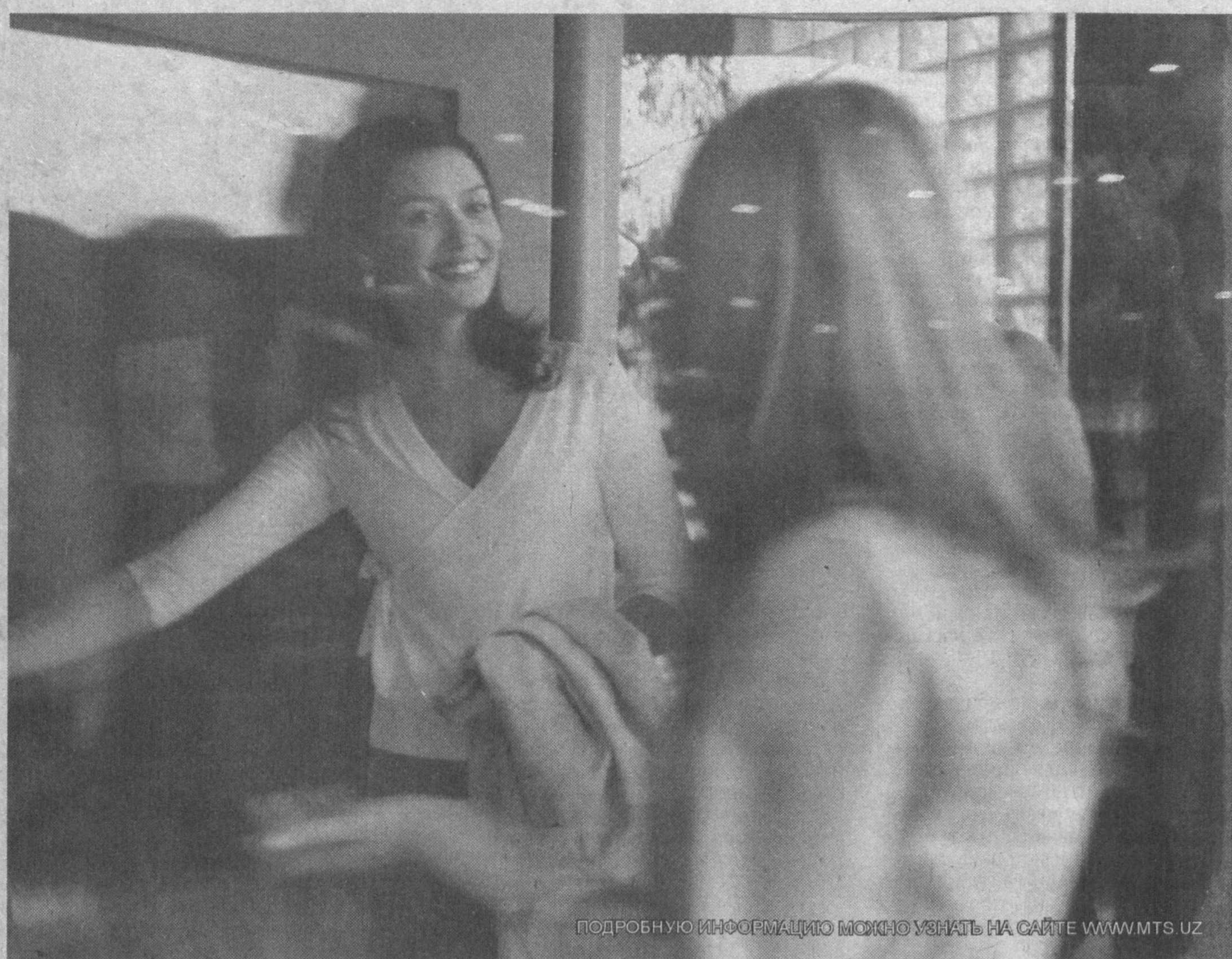
ПОДРОБНУЮ ИНФОРМАЦИЮ МОЖНО УЗНАТЬ НА САЙТЕ WWW.MTS.UZ