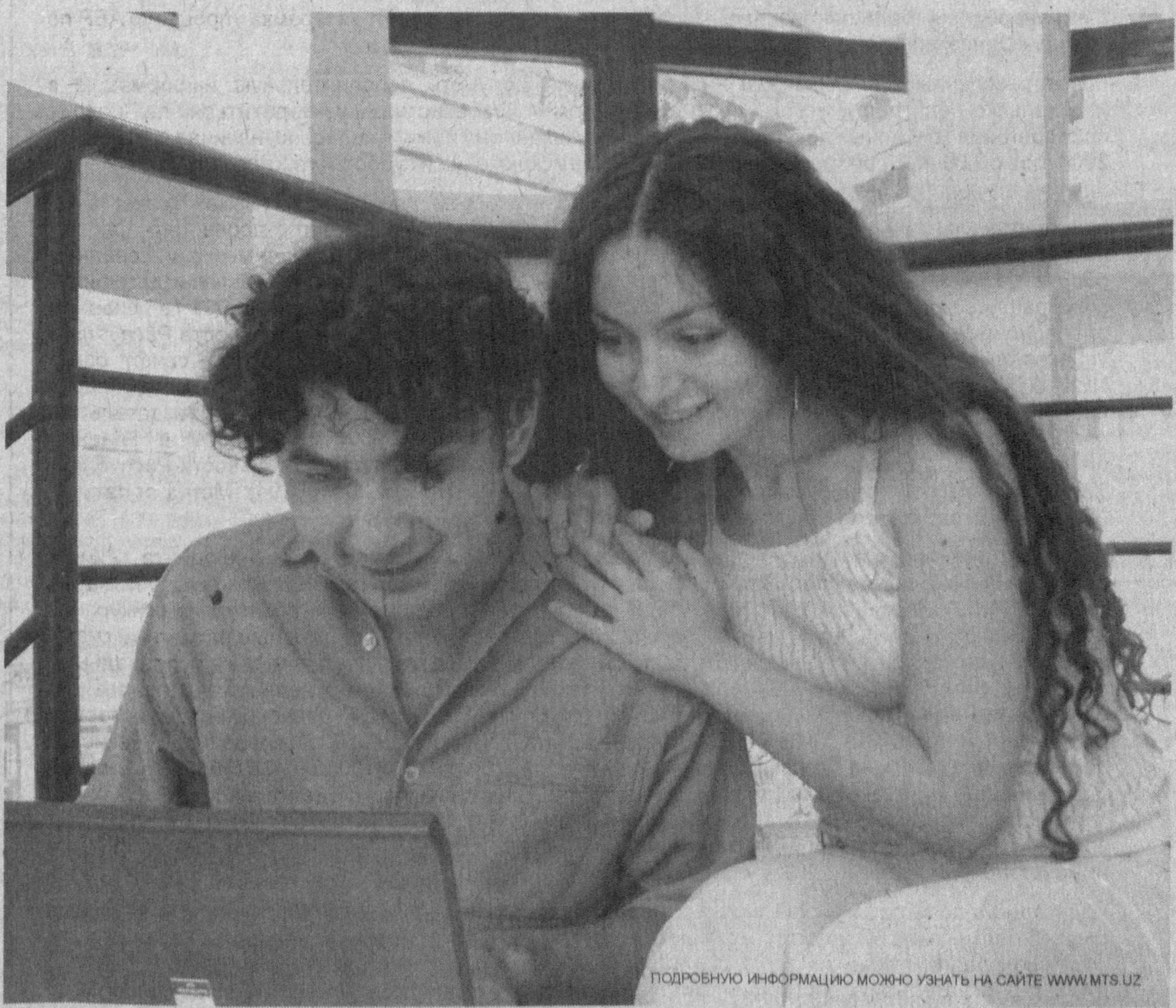
ПОДРОБНОЕ ИНФОРМАЦИЮ МОЖНО УЗНАТЬ НА САЙТЕ WWW.MTS.UZ

СВЯЗЬ ПО УЗБЕКИСТАНУ $0.04 (за 1 мин.) ВХОДЯЩИЕ ВНУТРИ СЕТИ БЕСПЛАТНО ИСХОДЯЩИЕ ВНУТРИ СЕТИ $0.02 (за 1 мин.)