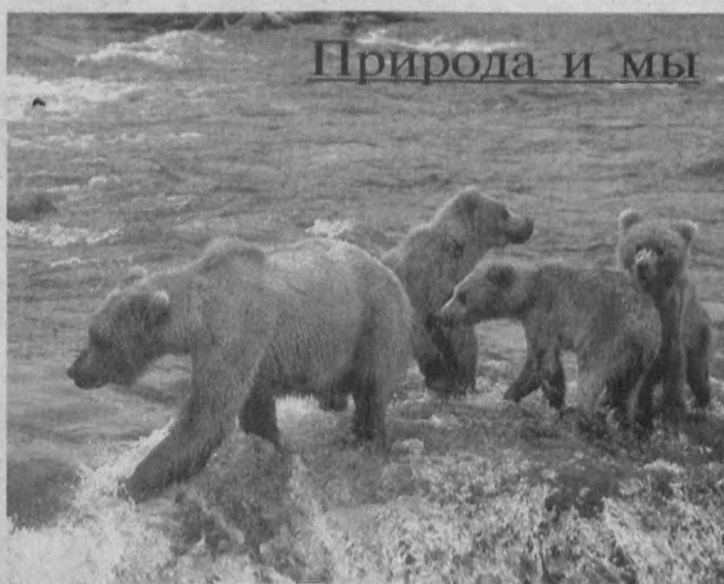
Природа и мы