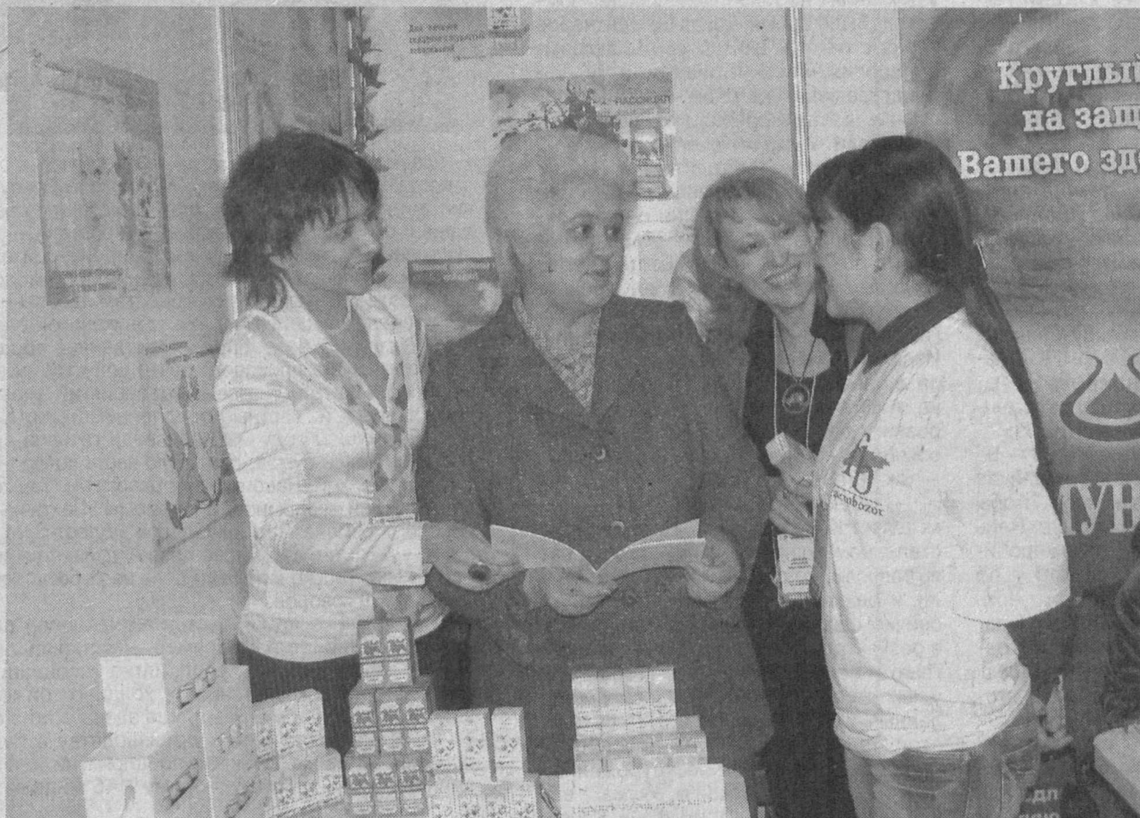
поставках в Россию, Кыргызстан и Таджикистан.