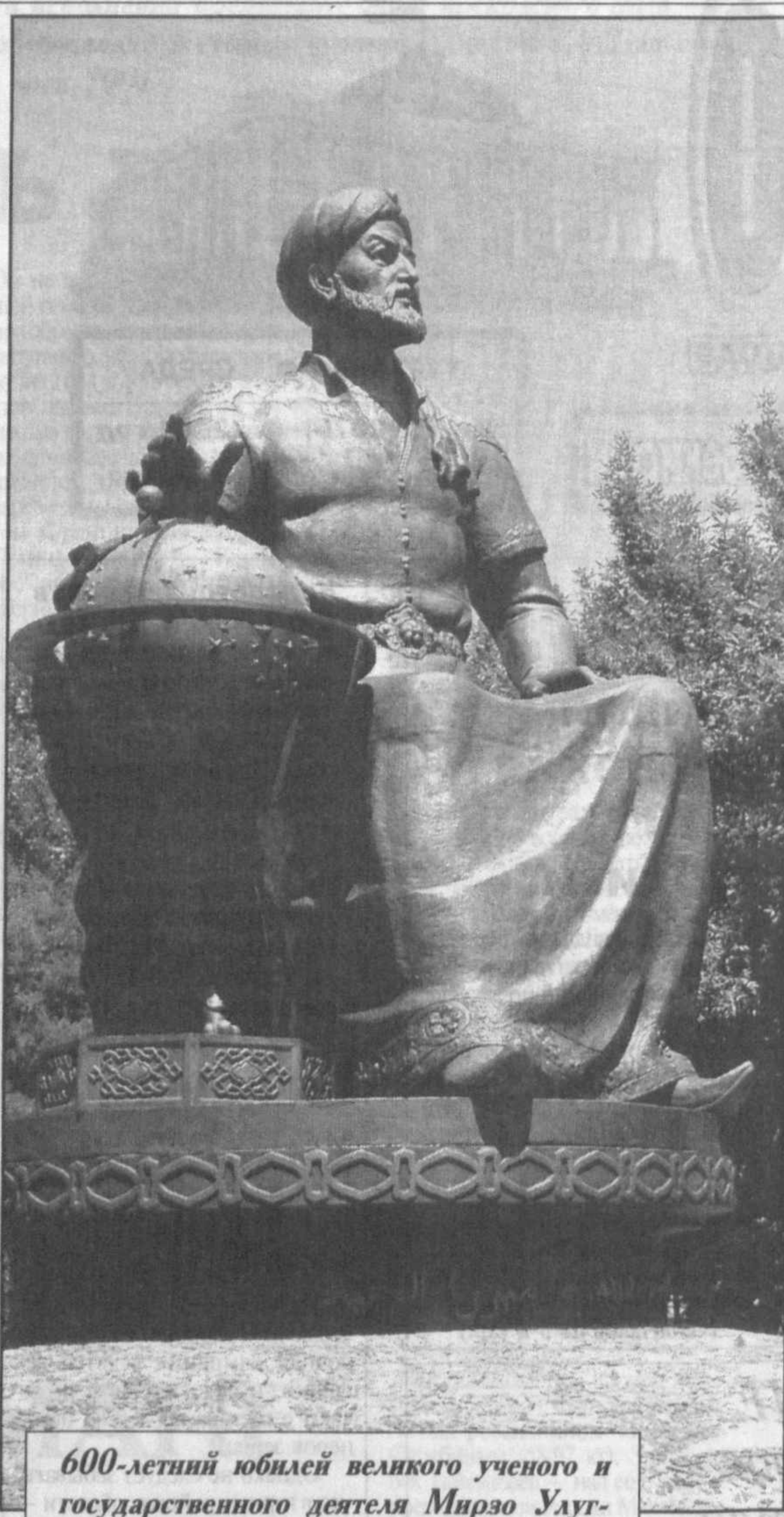
600-летний юбилей великого ученого и государственного деятеля Мирзо Улугбека широко отмечался не только в нашей стране, но и в Стамбуле, Париже, Карачи и других центрах мировой науки и общественной мысли.