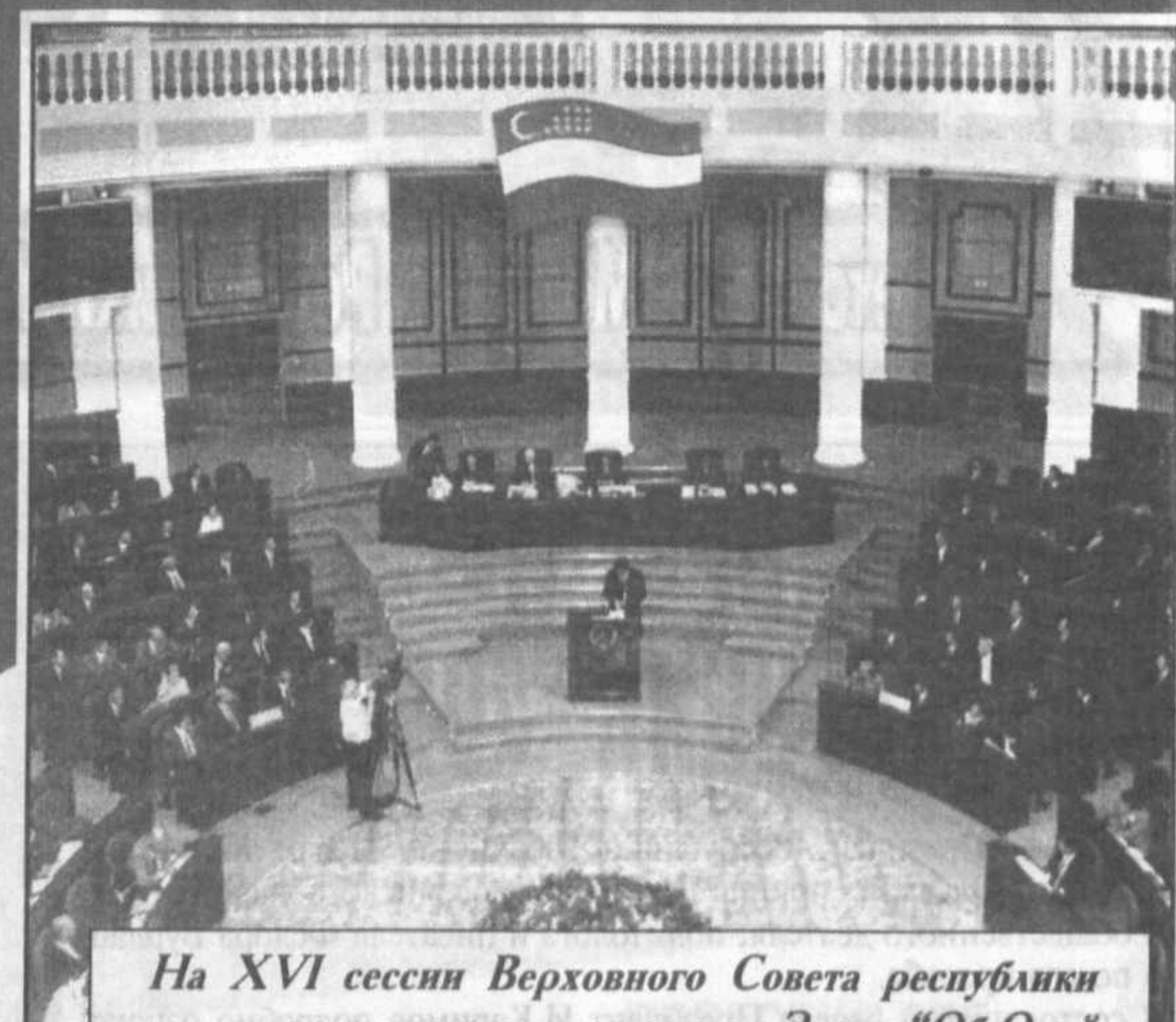
На XVI сессии Верховного Совета республики депутаты рассмотрели и приняли Закон "Об Олий Мажлисе Республики Узбекистан", определяя правовой статус, полномочия и обязанности высшего законодательного органа страны.