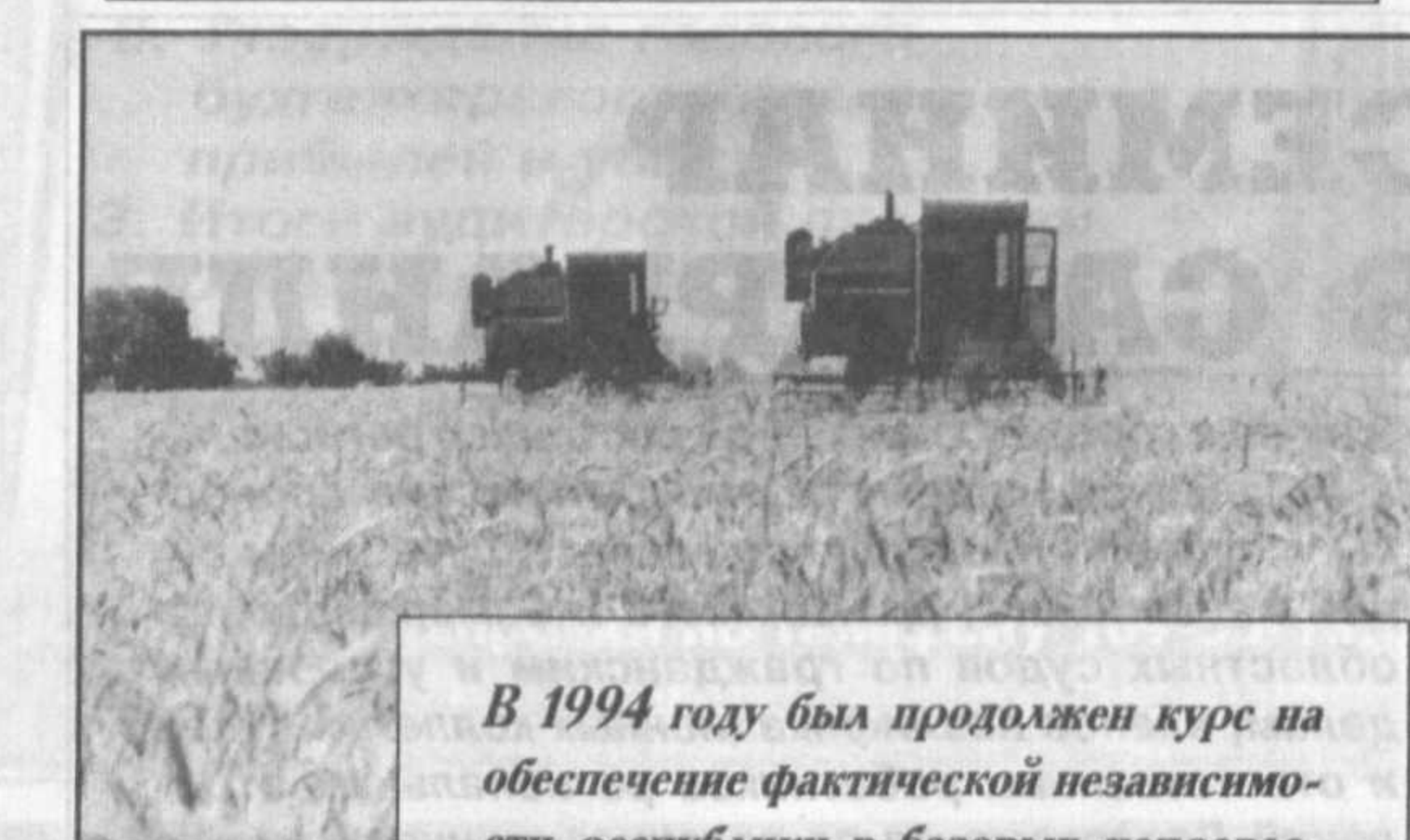
В 1994 году был продолжен курс на обеспечение фактической независимости республики в базовых направлениях народного хозяйства — производстве зерна, добыче и переработке нефти, насыщении рынка продовольственной продукцией.

форм, обеспечению защиты частной собственности и развитию предпринимательства". Он подвел итог первому этапу экономических реформ в Узбекистане и как бы ознаменовал начало нового периода в формировании рыночной экономики.