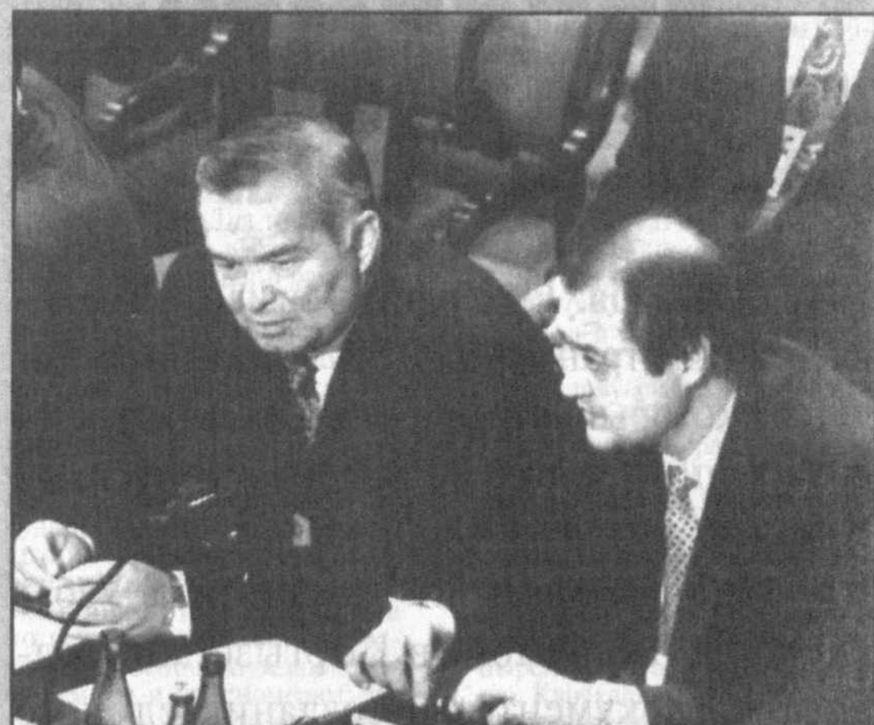
В декабре 1994 года делегация нашей страны во главе с Президентом Исламом Каримовым приняла участие во встрече руководителей государств и правительств стран — членов СБСЕ.