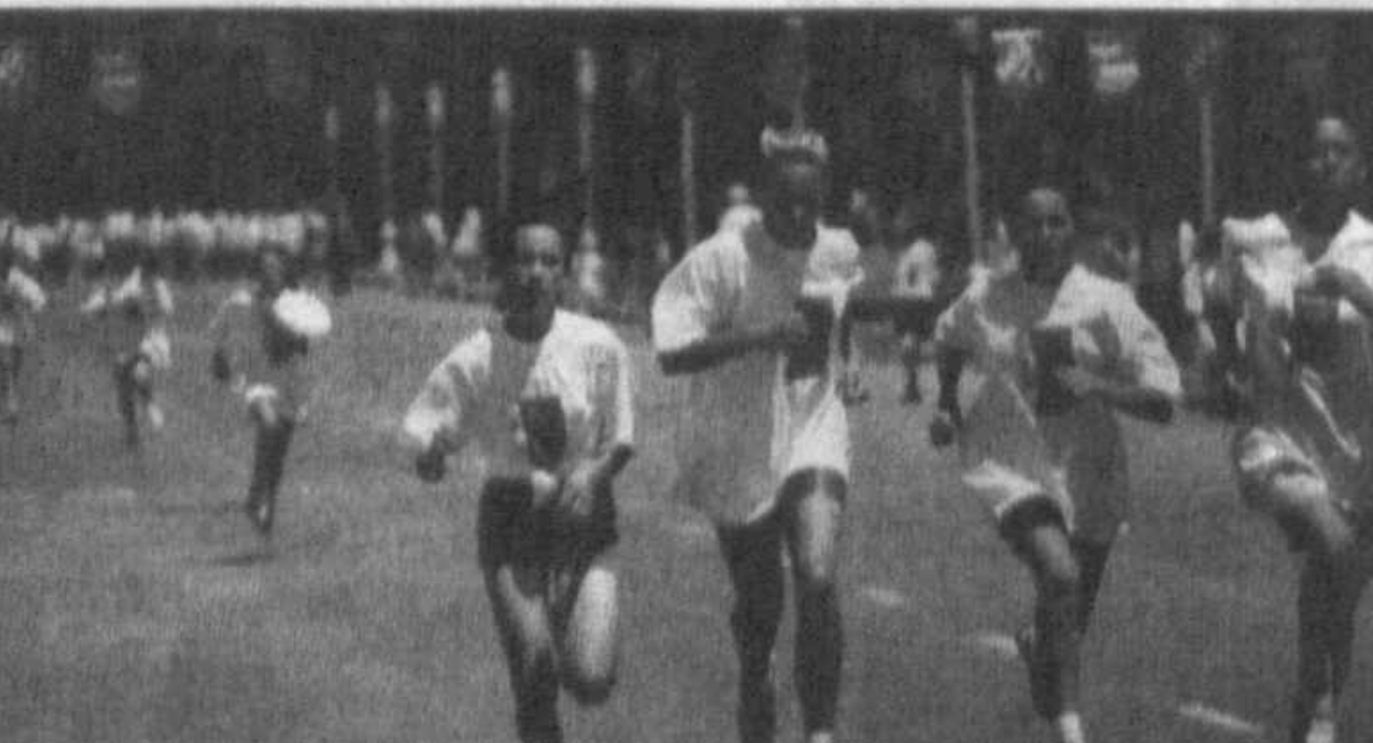
Материалы подготовил Сергей ДАНИЛОВ, наш корр.