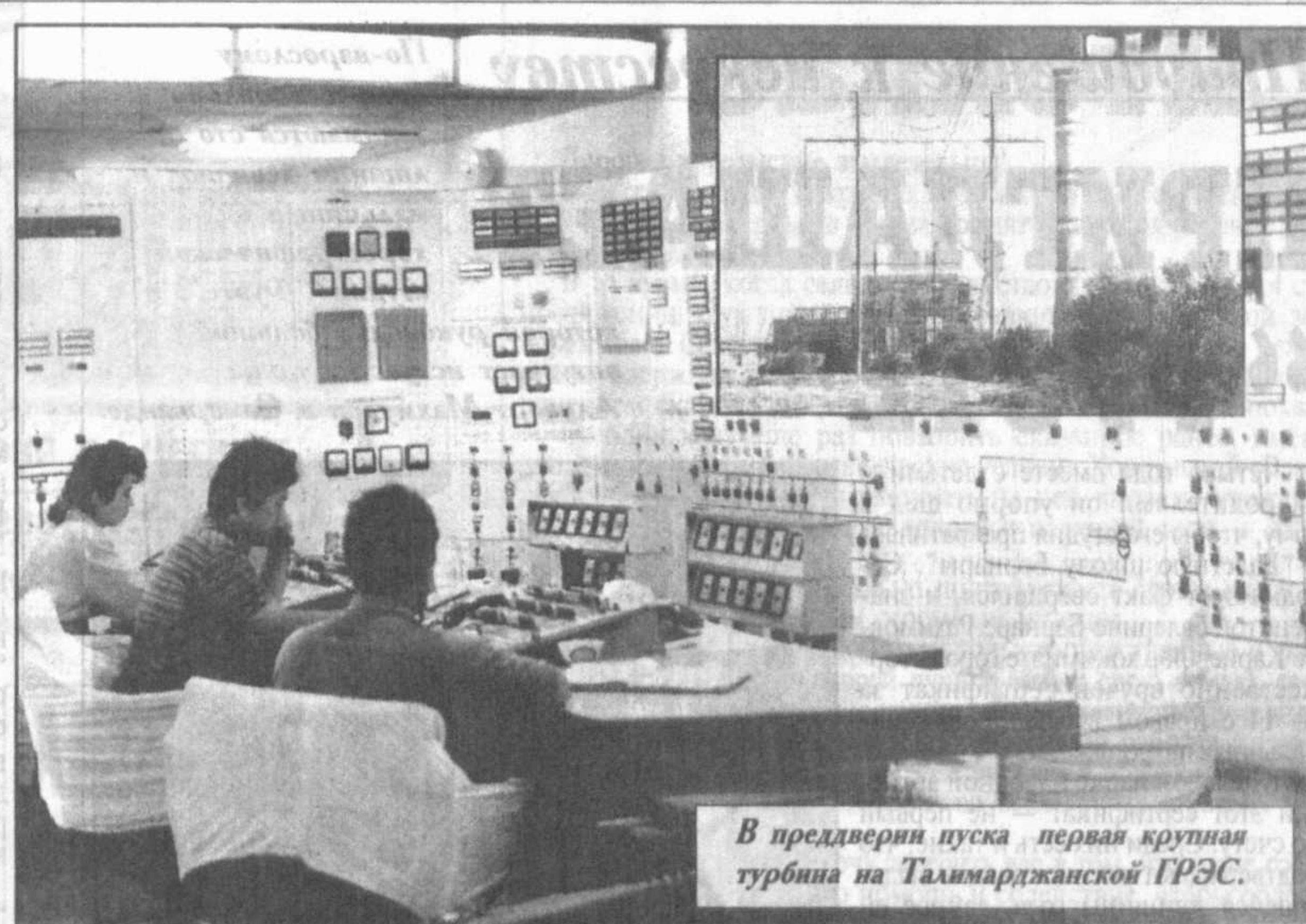
В преддверии пуска первая крупная турбина на Талимарджанской ГРЭС.

“ОБЕСПЕЧЕНИЕ СОЦИАЛЬНОГО И ГРАЖДАНСКОГО СОГЛАСИЯ, МИРА И СТАБИЛЬНОСТИ ПРИОБРЕТАЕТ СЕЙЧАС ПОИСТИНЕ РЕШАЮЩЕЕ ЗНАЧЕНИЕ ДЛЯ СТАНОВЛЕНИЯ И УКРЕПЛЕНИЯ ГОСУДАРСТВЕННОСТИ И УТВЕРЖДЕНИЯ СПРАВЕДЛИВОГО СОЦИАЛЬНОГО СТРОЯ”.