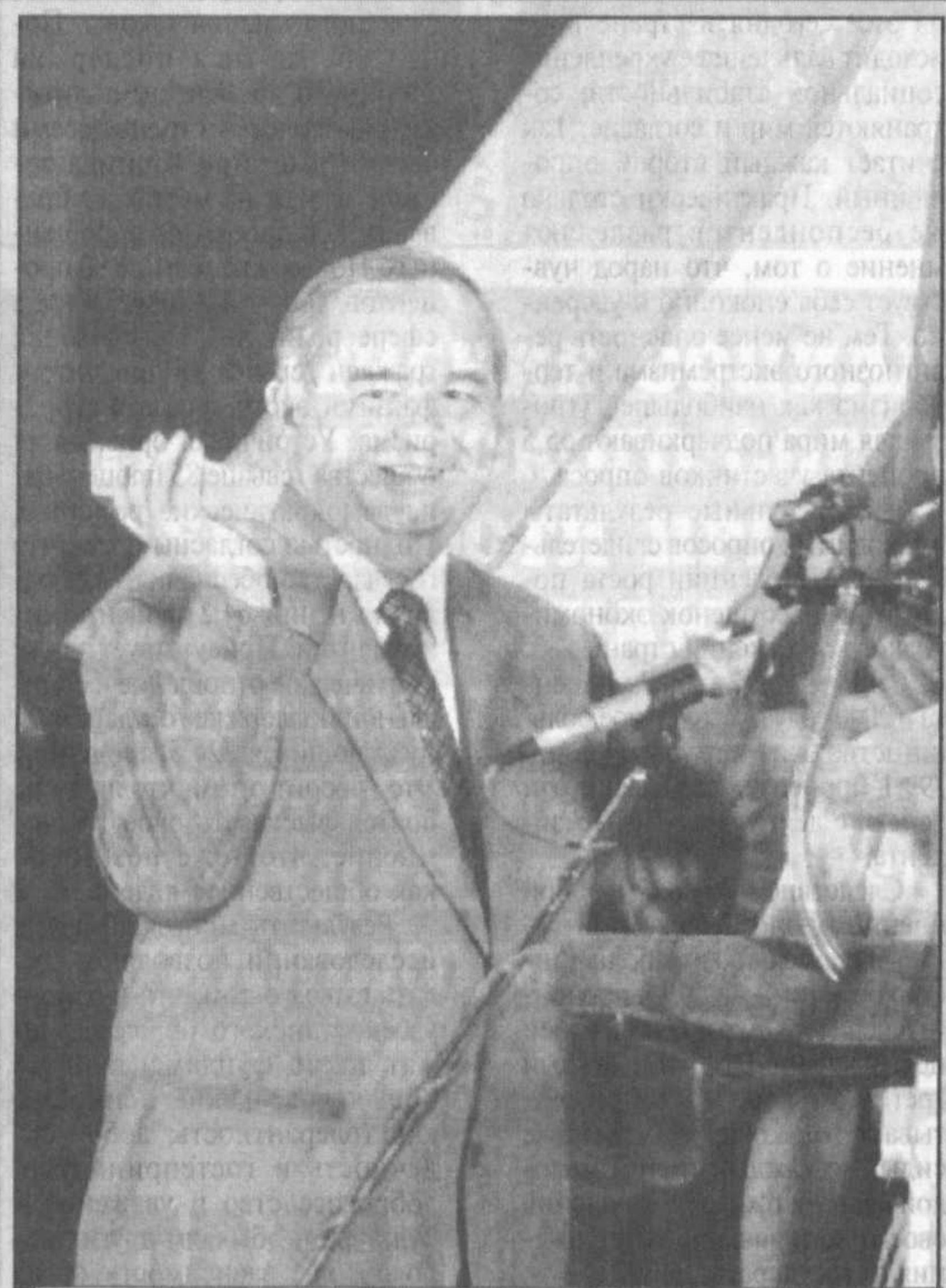
Июнь 1995-го. Торжественные минуты открытия первой очереди Учкудуского гидрометаллургического завода № 3 Навоийского ГКМ.