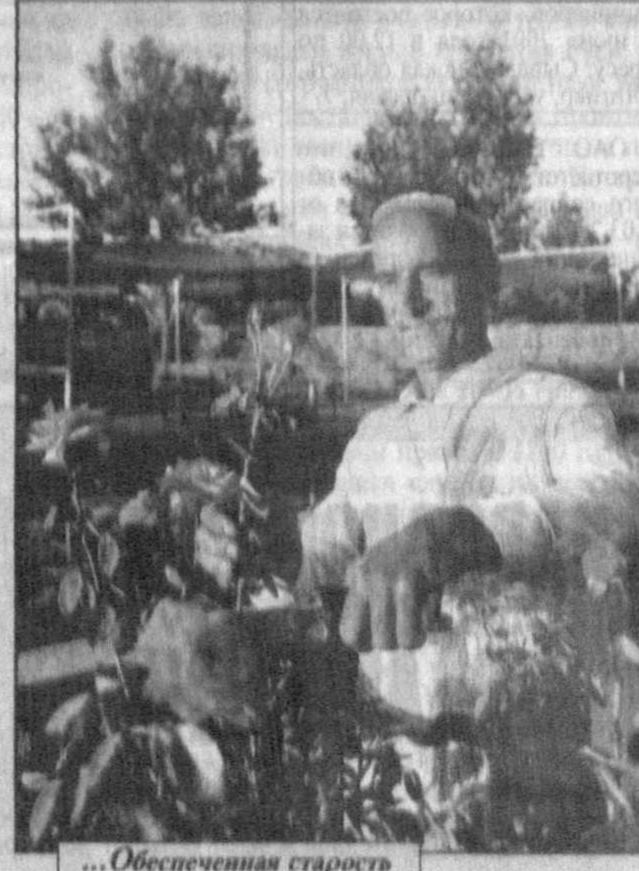
... Обеспеченная старость