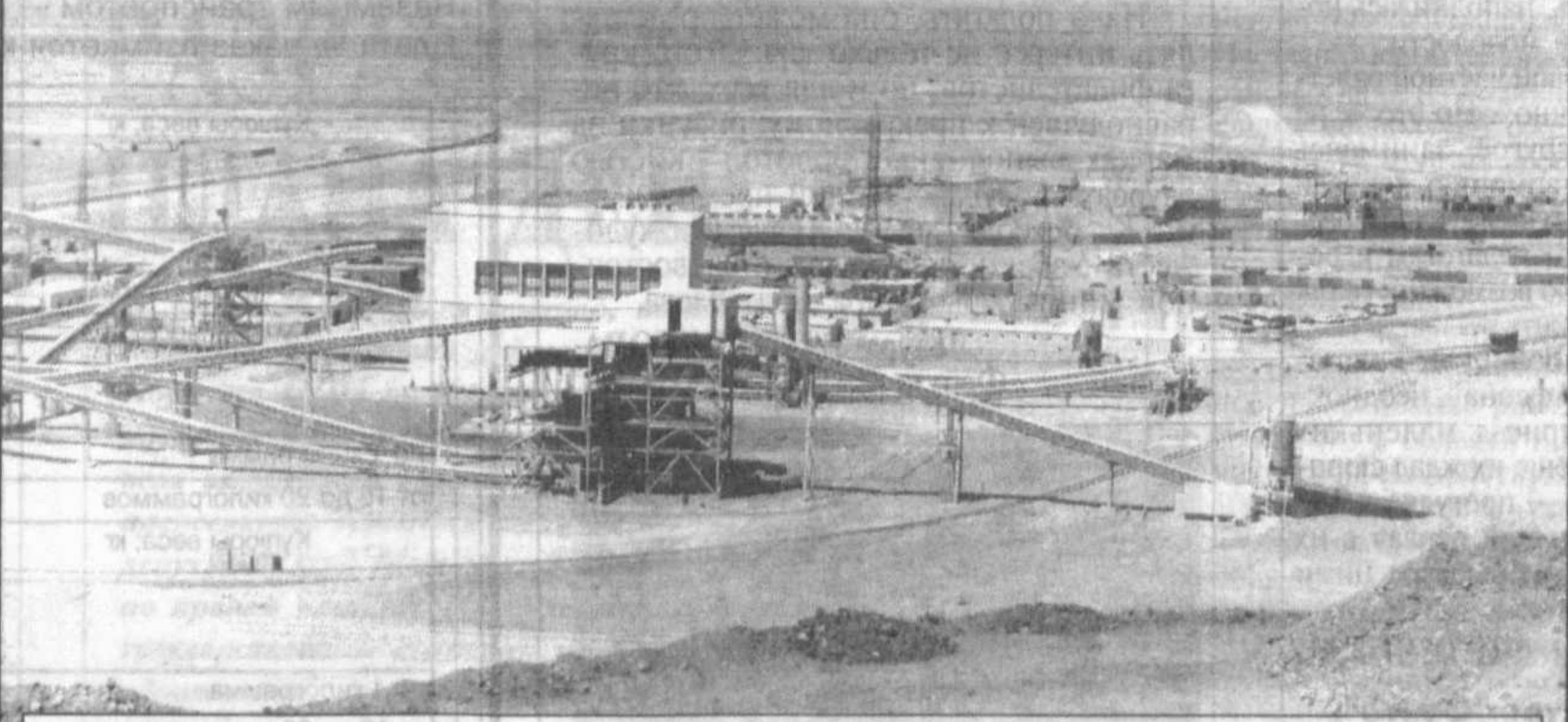
В мае 1995 года в пустыне Кызылкум начало работать СП «Зарафшан-Ньюмонт».