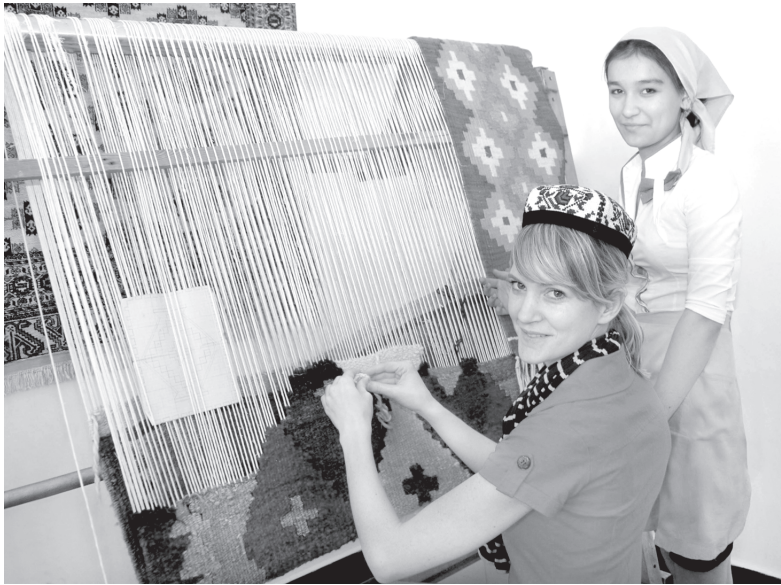
77 фоизи кичик бизнес ва хусусий тадбиркорлик соҳасида меҳнат қилмоқда.

Хозир қай бир соҳани олиб қараманг, унда кичик бизнес ва хусусий тадбиркорликнинг ҳиссаси катта бўлаётганини кўриш мумкин. Зеро, бутун мамлакатимизда бўлгани каби Бухорода ҳам тадбиркорлик равнақига алоҳида эътибор қаратилаётди. Агар бундан ўн йил муқаддам вилоятда 15 минг 848 кичик бизнес корхонаси фаолият юритган бўлса, 2012 йилга келиб уларнинг сони 27 минг