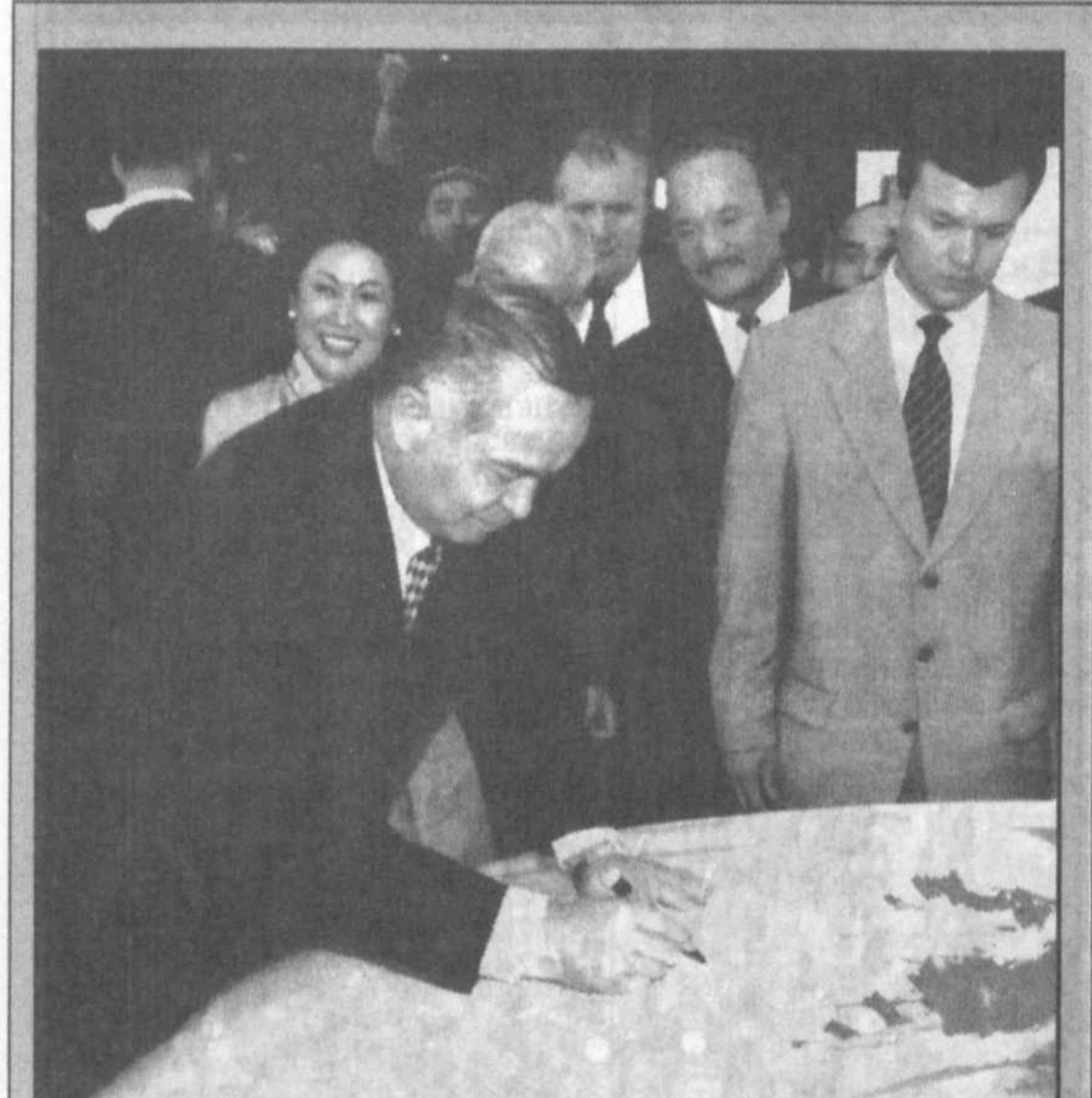
1996 год. 19 июля. Президент страны Ислам Каримов ставит памятный автограф на капоте первого автомобиля, сошедшего с конвейера СП «УзДЭУавто».