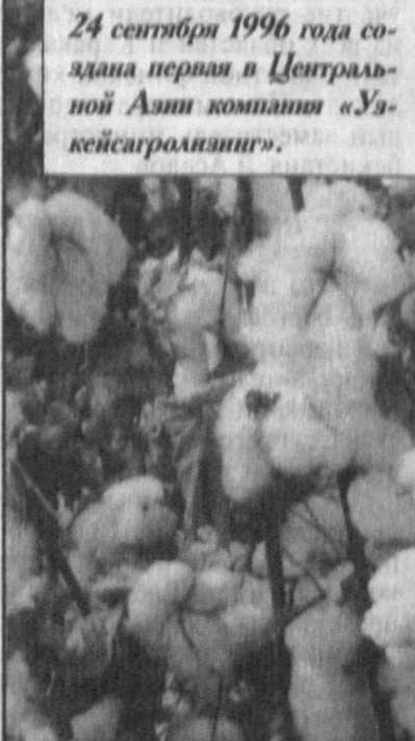
24 сентября 1996 года создана первая в Центральной Азии компания «Узкейсагролизинг».