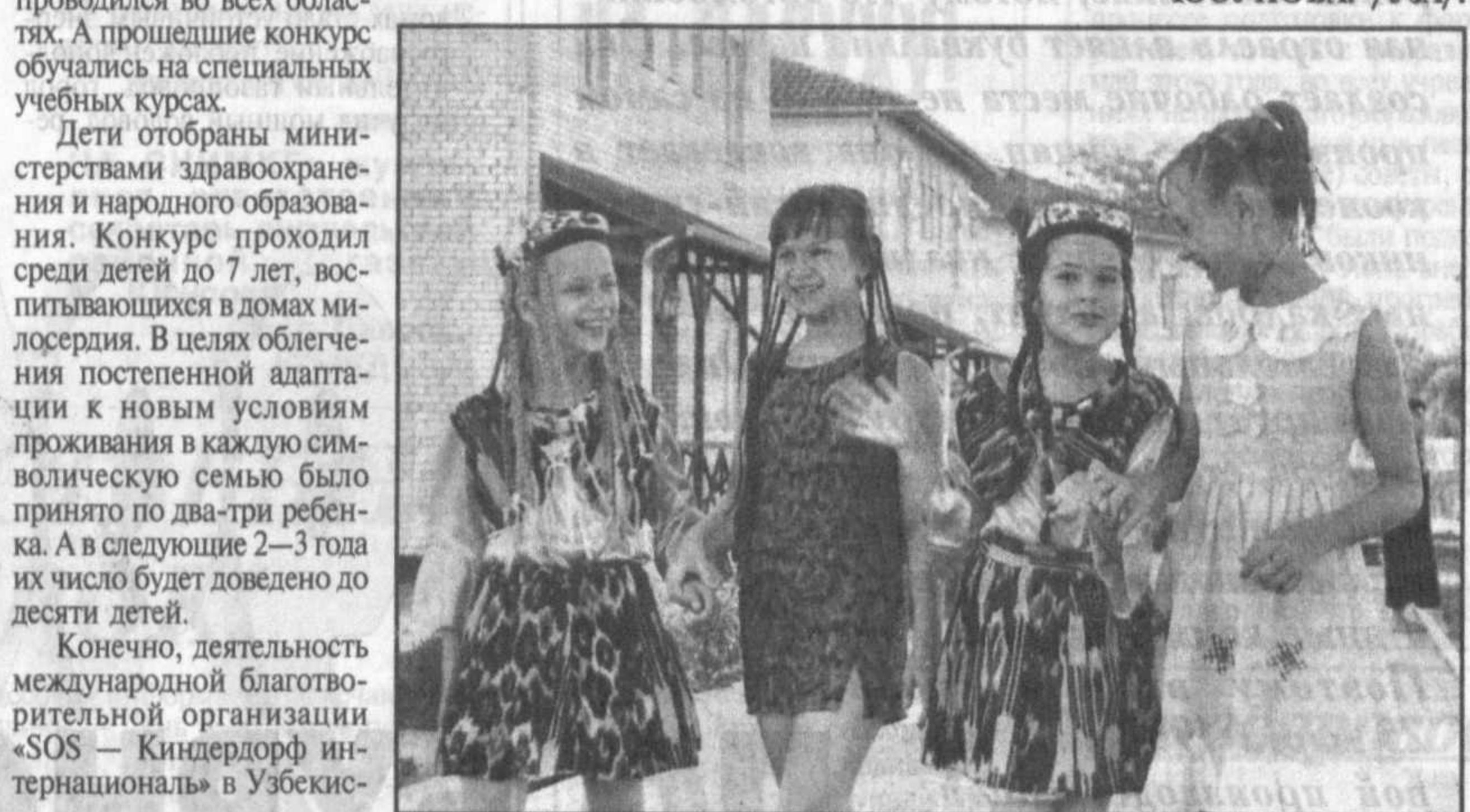
В Ташкенте открыта первая «SOS-детская деревня».

Бобур СОБИРОВ. /Уз./ Фото Дильнода ЮСУПОВА. /Уз./