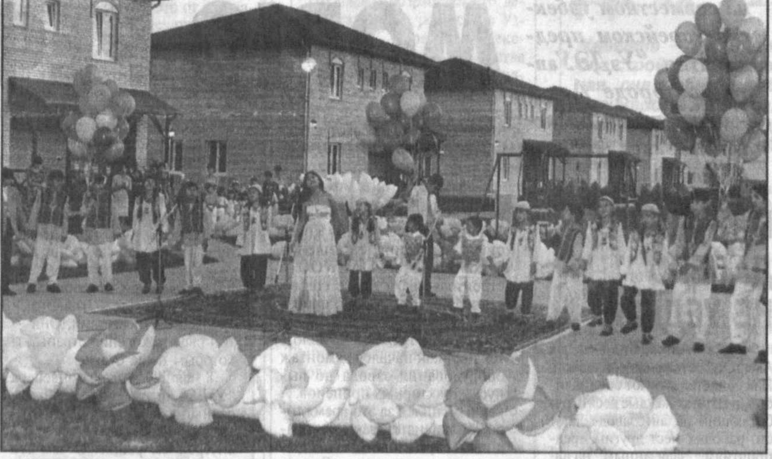
Дети играют в новой «SOS-детской деревне».

В нашей стране под руководством Президента Ислама Каримова уделяется серьезное внимание воспитанию молодого поколения. Особенно достойны похвалы меры, проводимые правительством на пути охраны здоровья материнства и детства. Объявление по инициативе руководителя нашей страны первого года нового столетия в нашей республике Голом матери и ребенка и открытие именно в этом году «SOS-детской деревни» является большим событием. Выступившие на торжественной церемонии особо отметили, что правительство Узбекистана проводит много добрых дел в социальной сфере, и это с большим воодушевлением отмечается мировым сообществом.