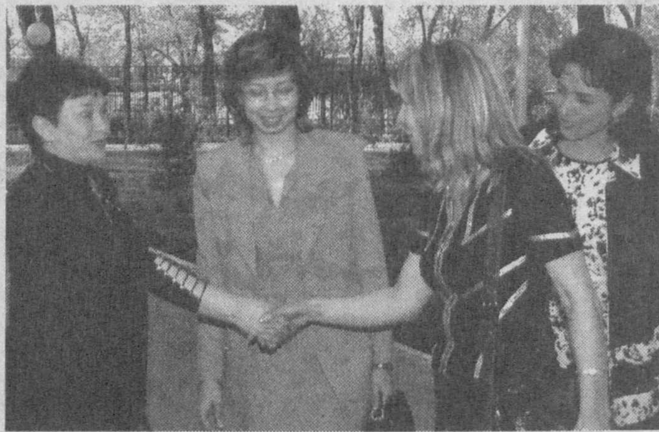
Федерация синхронного плавания, организованная в 2000 году при поддержке Комитета женщин Узбекистана, помогла поменять отношение многих к этому виду спорта. В настоящее время синхронным плаванием в республике занимаются более 400 девочек. Конечно, цифра не столь уж и впечатляющая в масштабах страны, но то, что процесс сдвинулся с мертвой точки, это уже можно констатировать. Такая возможность появилась еще и потому, что в Узбекистане создана прочная спортивная база, включающая в себя бассейны и залы, отвечающие самым высоким мировым стандартам.