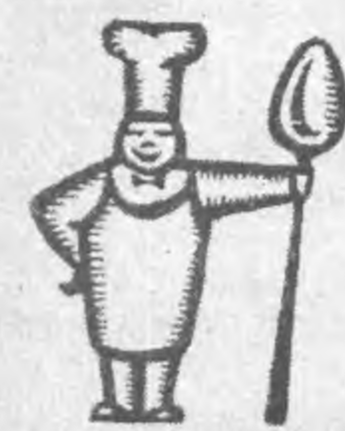
Рис — на любой каприз