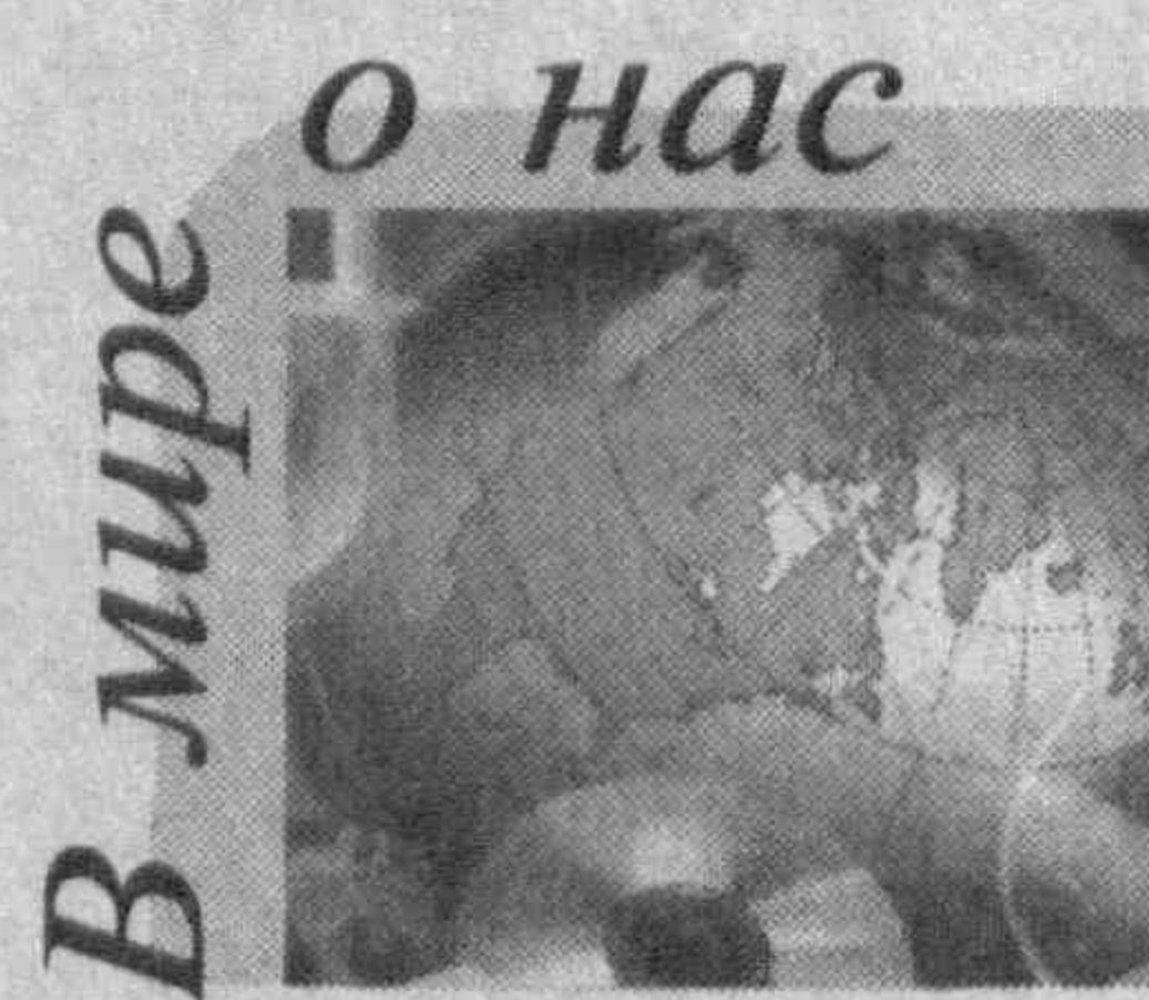
О нас В мире (Окончание. Начало на 1-й стр.)