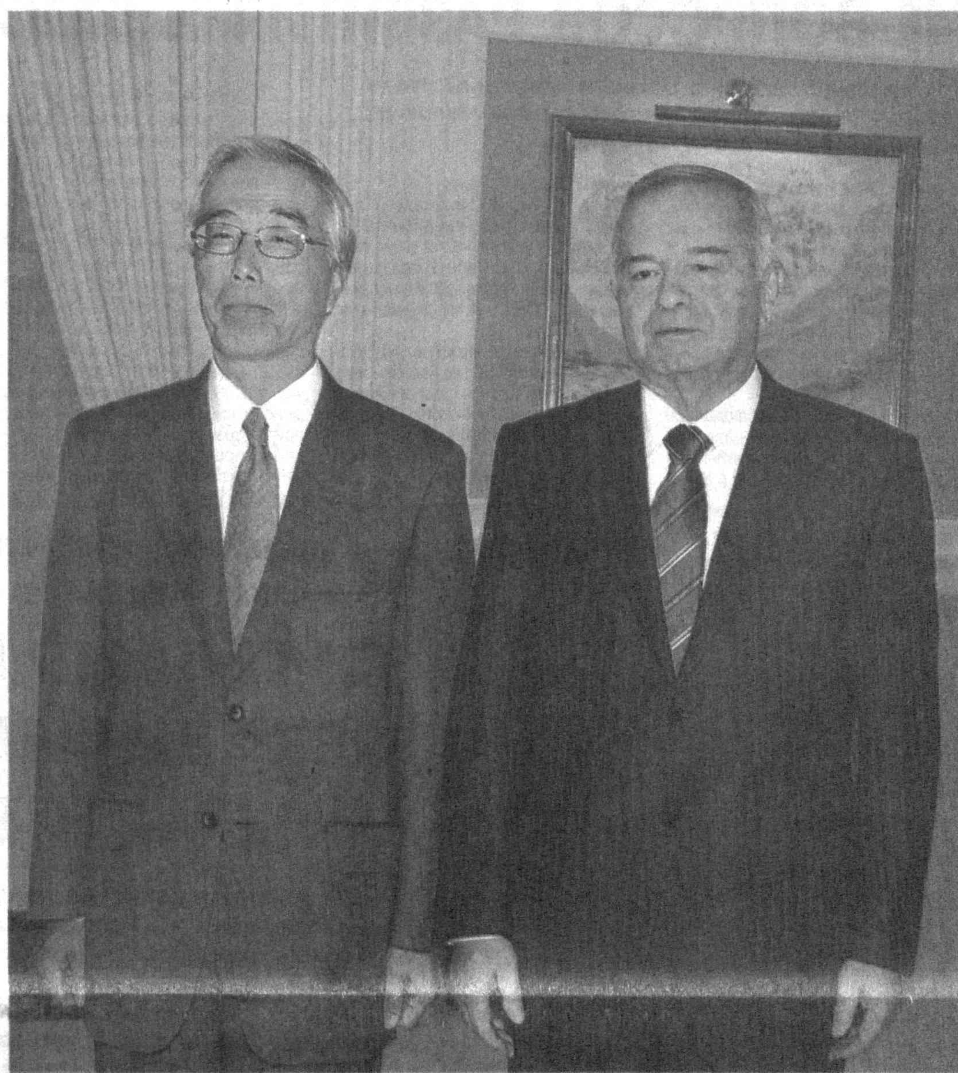
УзА. Фото Абдувохида ТУРАЕВА, УзА.

В ходе беседы состоялся обмен мнениями по вопросам, затрагивающим возможность осуществления новых проектов совместно с «Isuzu Motors», развития технического и инвестиционного сотрудничества между нашими предприятиями и этой компанией.