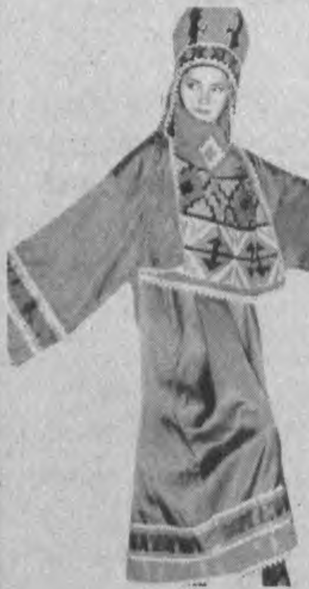
Программа Второго открытого фестиваля включает в себя концерты в селениях Байсуна, "Fashion-Show" — конкурс модельеров традици-

Вот-вот ворвется в культурную жизнь республики "Бойсун бахори" ("Байсунская весна") – проект, представляющий фольклорное искусство стран Центральной Азии. Как уже было объявлено, он будет проходить с 14 по 19 мая в Байсунском районе Сурхандарьинской области. Это смотр лучших профессиональных и самодеятельных исполнителей, представляющих народную музыку, песни, танцы, произведения ремесленников и дизайнеров одежды.