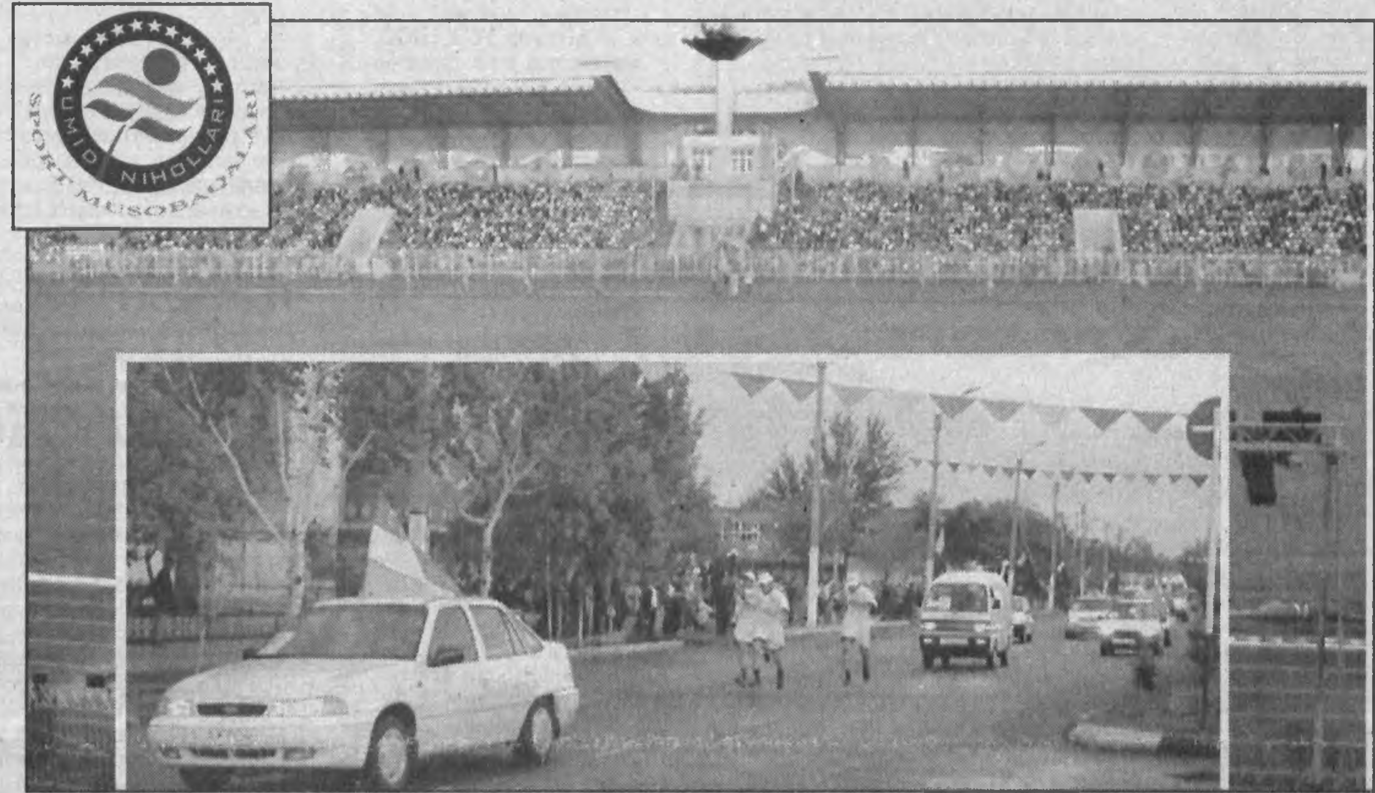
Игры школьников Республики Узбекистан «Умид нихоллари-2003»

Игры организованы Министерством народного образования, Государственным комитетом по физической культуре и спорту, Национальным олимпийским комитетом, Советом Федерации профсоюзов Узбекистана совместно с хокимиятом Хорезмской области.