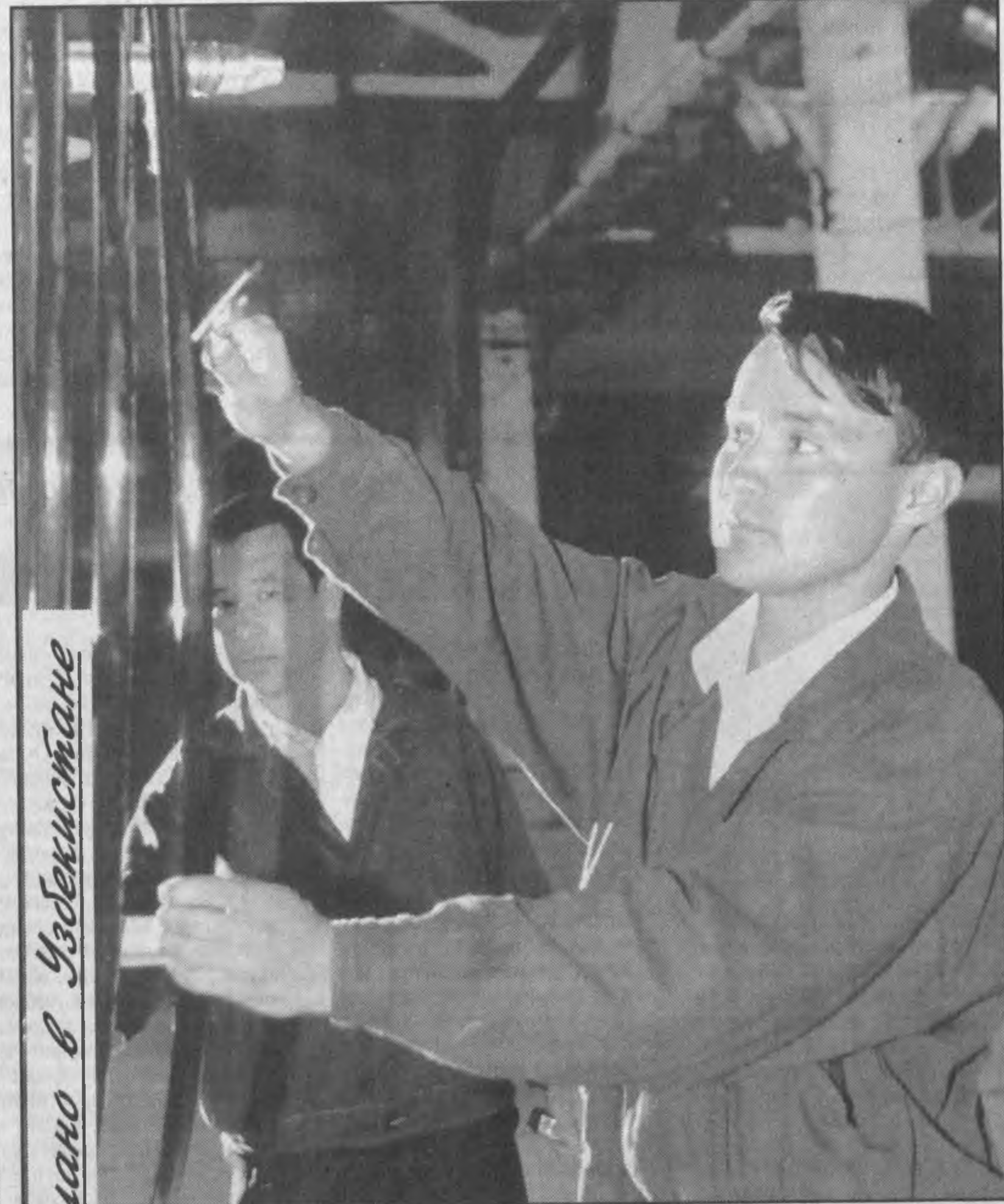
Сделано в Узбекистане

финансовом отношении. Кроме того, в повестку дня включены и экономические вопросы. Не останутся без внимания и аспекты развития транспортных коммуникаций между государствами, их взаимоподдержка для выхода на мировой рынок, сказал Ислам Каримов. *** МОСКВА, 28 мая. (Собщает спец. корр. УзА Анвар БОБОЕВ). Президент Республики Узбекистан Ислам Каримов прибыл в Москву для участия в саммите глав государств — членов Шанхайской организации сотрудничества (ШОС). В тот же день в Большом Кремлевском дворце состоялась неформальная встреча глав шести государств — членов ШОС. В ходе беседы состоялся обмен мнениями по вопросам нынешнего состояния экономических, политических и социальных связей между странами, сотрудничества в рамках ШОС. Основные встречи глав государств — членов ШОС — Узбекистана, России, Казахстана, Кыргызстана, Таджикистана и Китая — намечены на 29 мая. УзА.