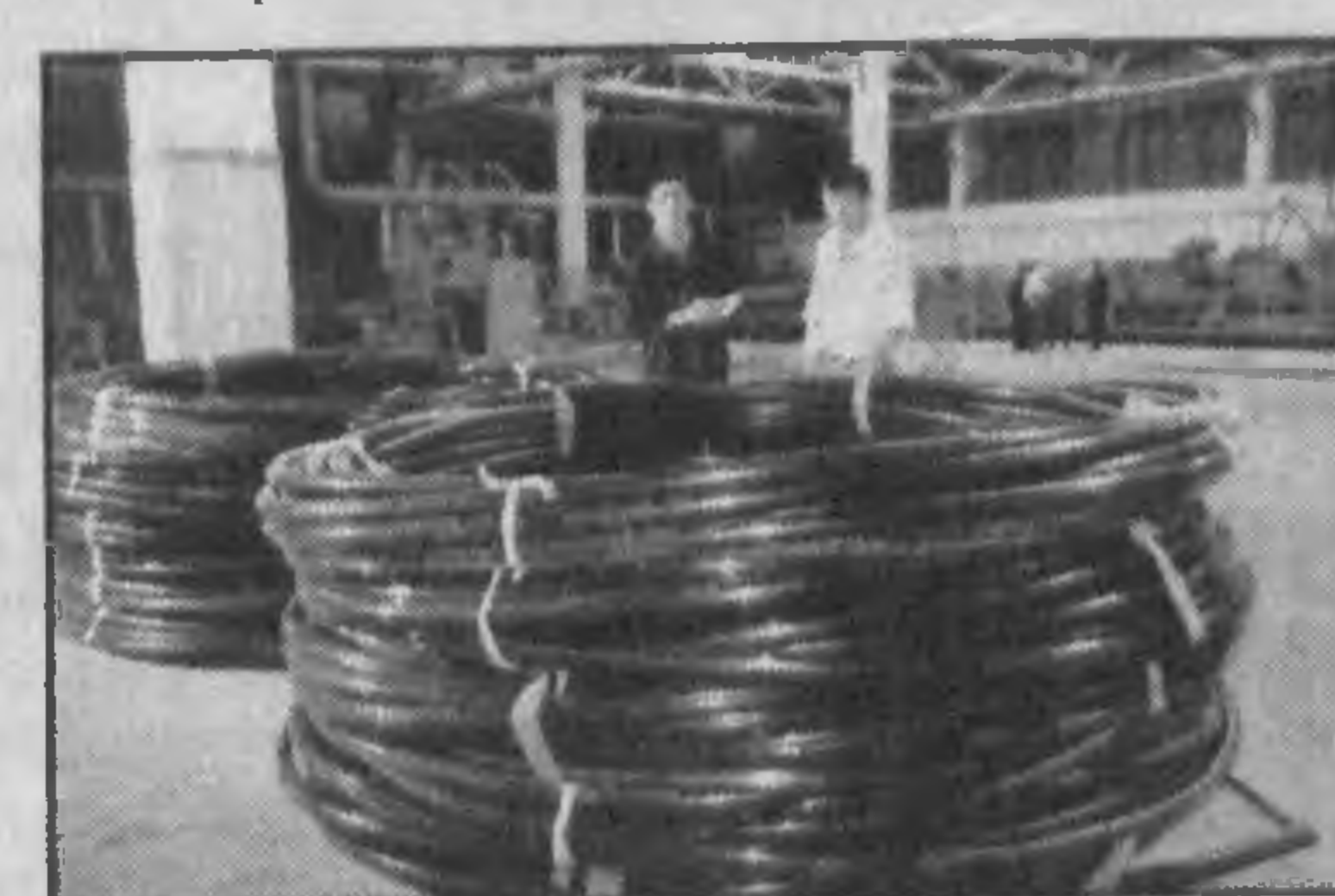
НА СНИМКАХ: главный специалист завода Кадыр Рузикулов; в одном из цехов предприятия.

Но ныне ОАО «Жиззакпластмасса» известно в Узбекистане как серьезный поставщик труб различного диаметра и самого разнообразного назначения: для водоводов, газопроводов, дренажных сетей, строительства, бытового назначения. Скоро на поток будет запущен новый образец — трубы большого диаметра. Тут уверены, что в самое ближайшее время можно полностью удовлетворить потребность страны в этом ассортименте.