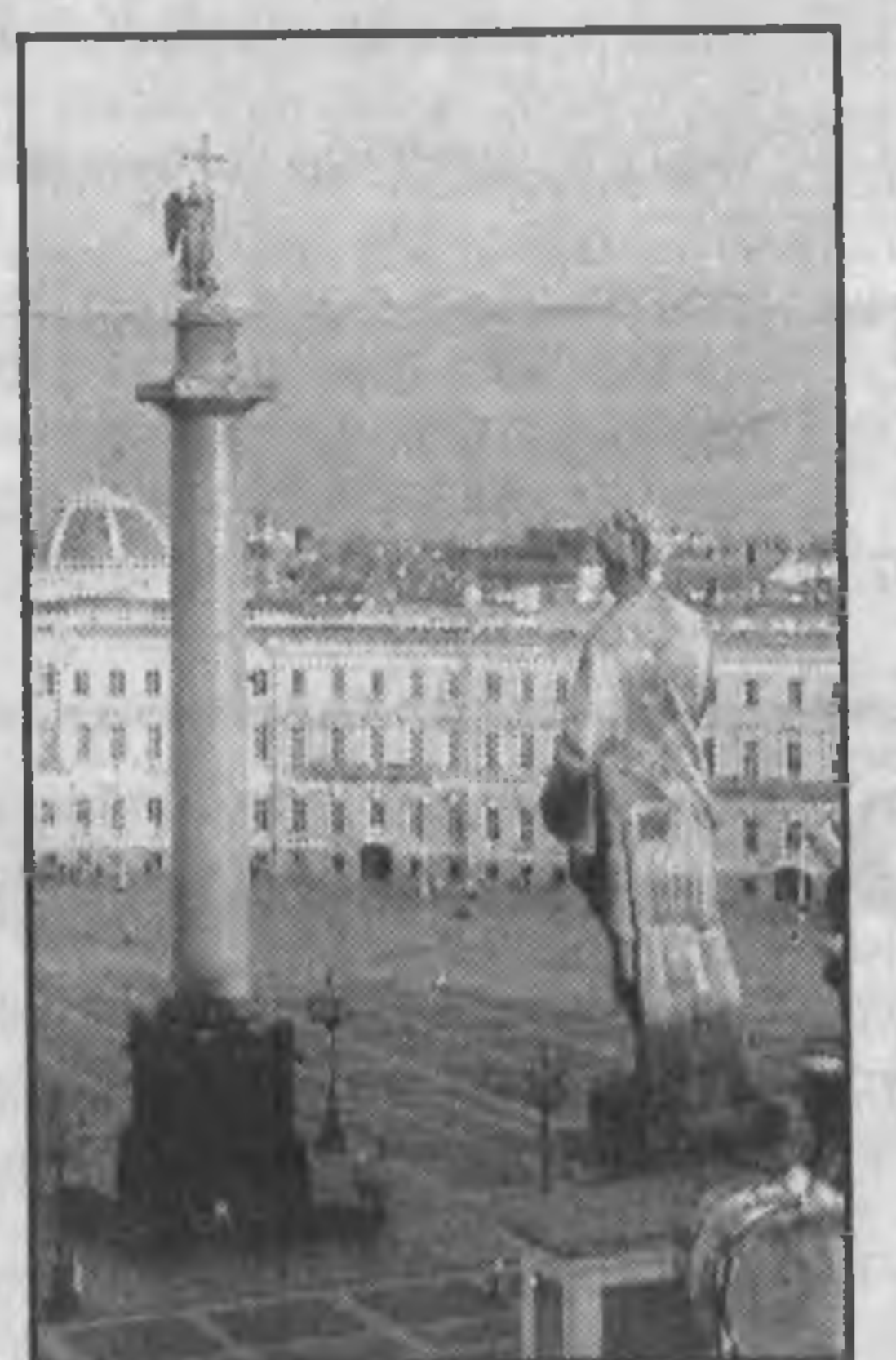
Вера Инбер с восхищением говорит:

городе Ташкенте в годы второй мировой войны. Да, многих ленинградцев, да и не только их приютил Узбекистан в те суровые дни. Поэты и писатели, проживавшие в нашей республике, посвятили Узбекистану свои книги и циклы стихов. В любой строчке их произведений читатель ощущает ту любовь и трепет, с которыми они относились к узбекской земле, его трудолюбивому народу. В своем стихотворении «Воспоминания об Узбекистане» ленинградская поэтесса