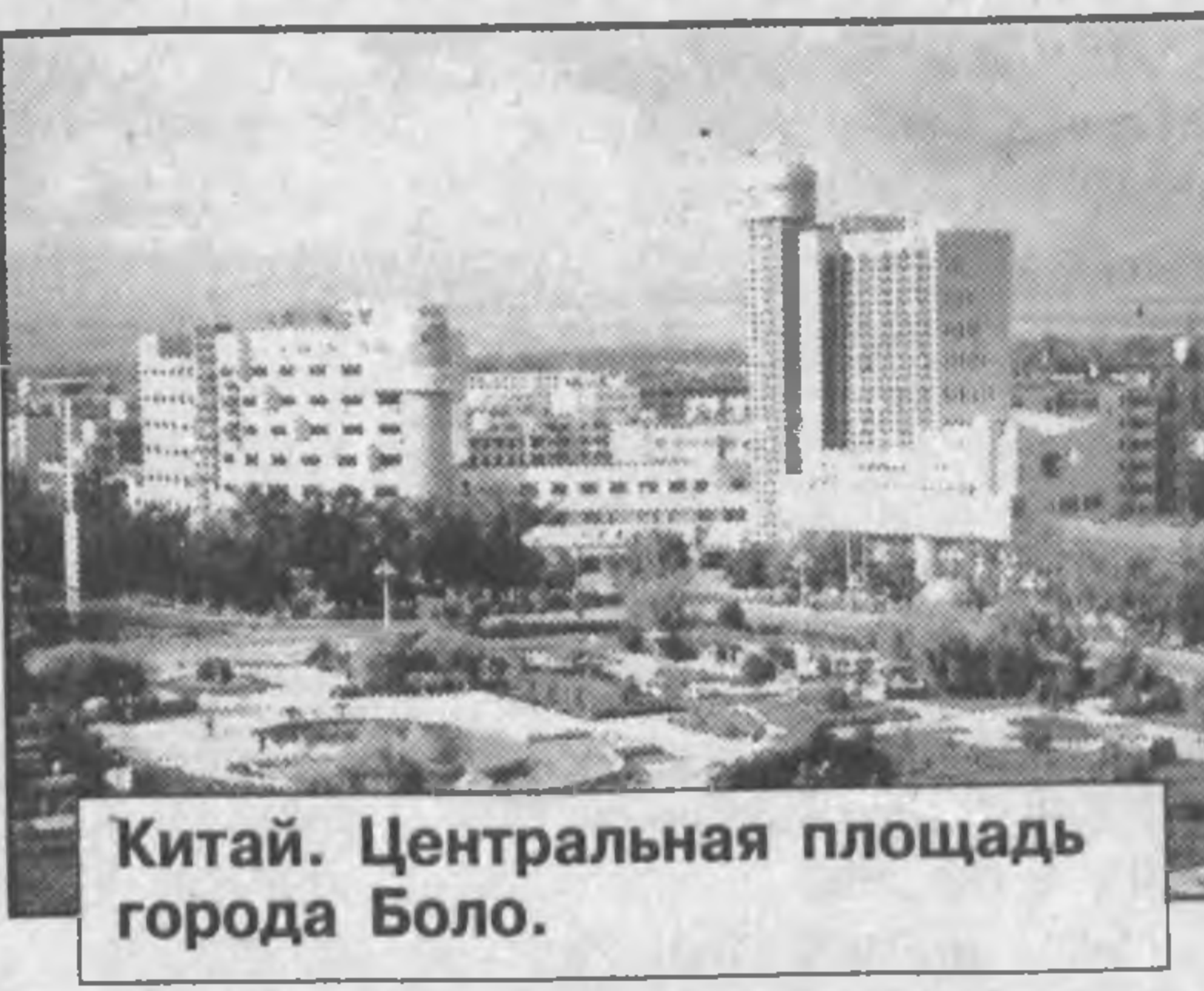
Китай. Центральная площадь города Боло.

АБР имеет на сегодня в Узбекистане 14 текущих проектов, в том числе четыре новых, которые были одобрены в прошлом году, на общую сумму 237 миллионов долларов США.