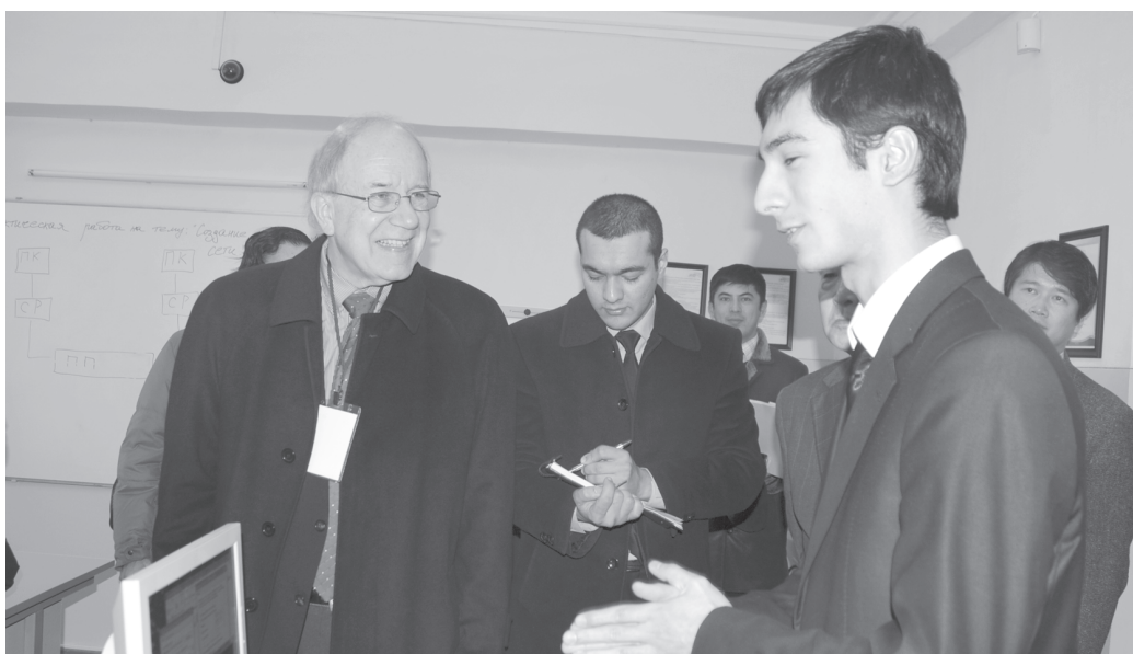
Тошкент ахборот технологиялари касб-хунар коллежи ўқувчиларининг интеллектуал салоҳияти хорижийлик мутахассисларининг ҳам ҳавасини келтирди.