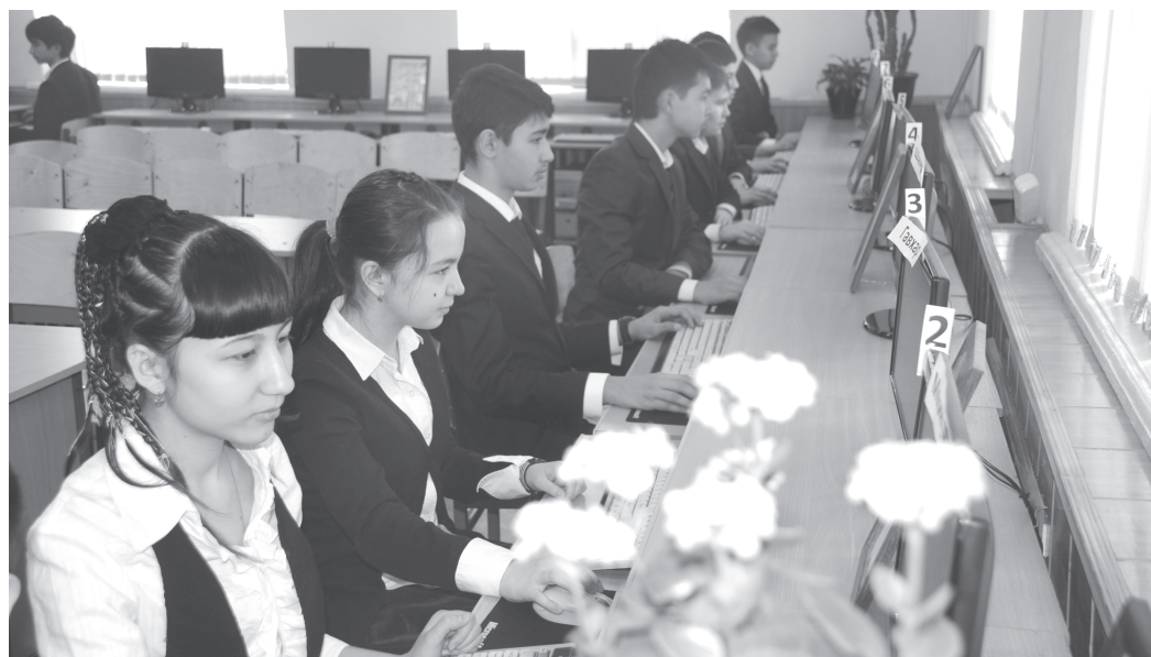
Мирзо Улуғбек туманидаги 50-сонли иқтисодлаштирилган умумтаълим мактабидан навқирон авлоднинг пухта билим олиши учун барча шарт-шароит яратилган.