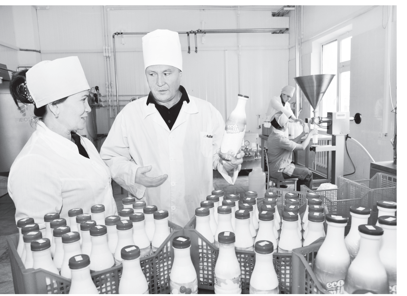
«(Давоми. Бошланиши 1-бетда).

Шу мақсадда озуқа етиштиришга мўлжалланган 772 гектар экин майдони ажратилиб, 8 гектарлик чорвачилик комплекси бунёд этилган. Мана шундай имкониятларга эга мажмуада иш юри-