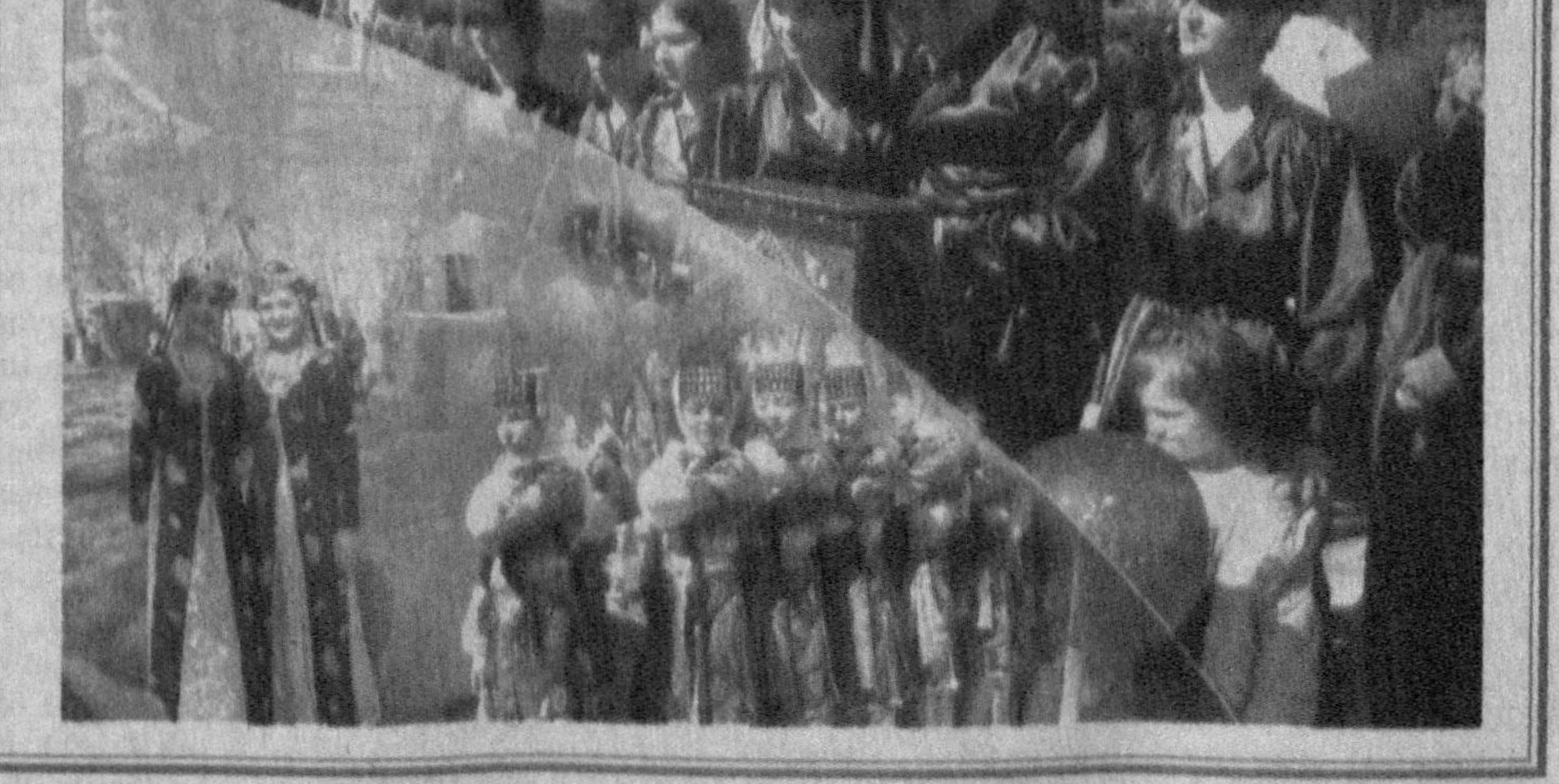
Ўзбечилар уюшмаси вилоят бўлимида