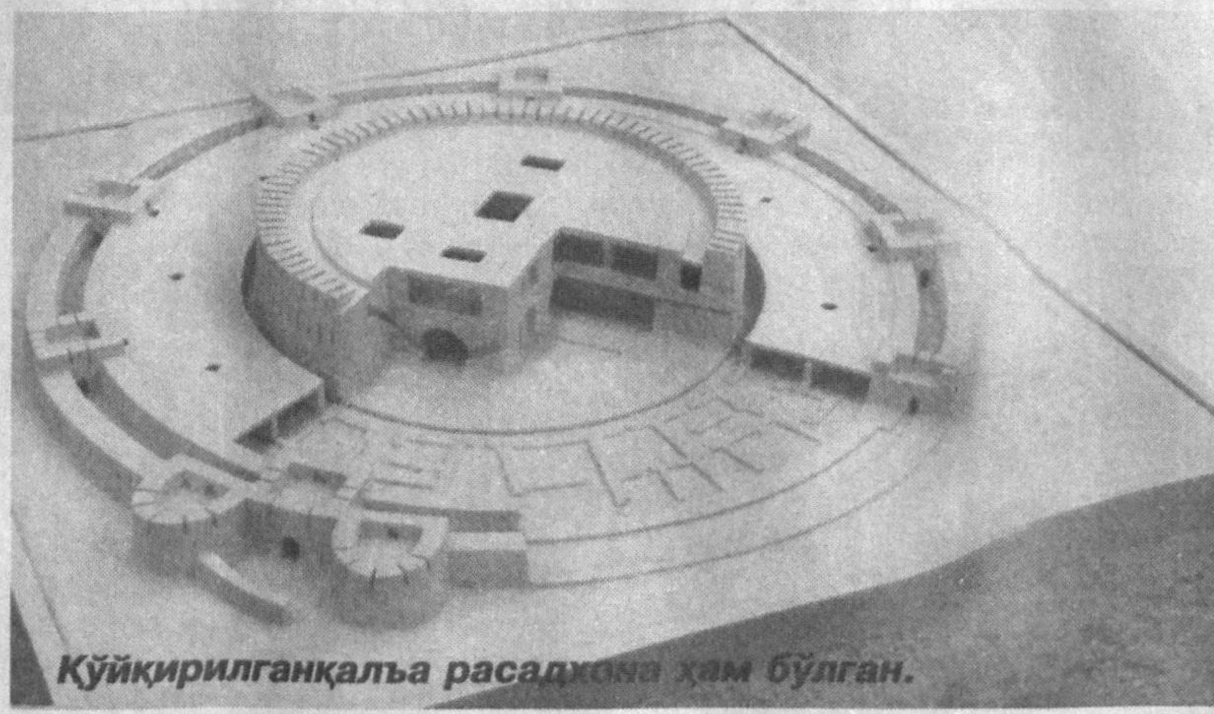
Қуйқирилган қалъа расадқона ҳам бўлган.

Музейимизнинг ноёб осори-атикаларидан яна бири икки бошли илон тасвири туширилган айлана шаклидаги катта тумордир. Тоддан ясалган ва унга зурад, ақиқ, феруза каби қimmatбахо маъданлардан зеб бериб ишланган бу тумор Фарғона водийсидан топишган.