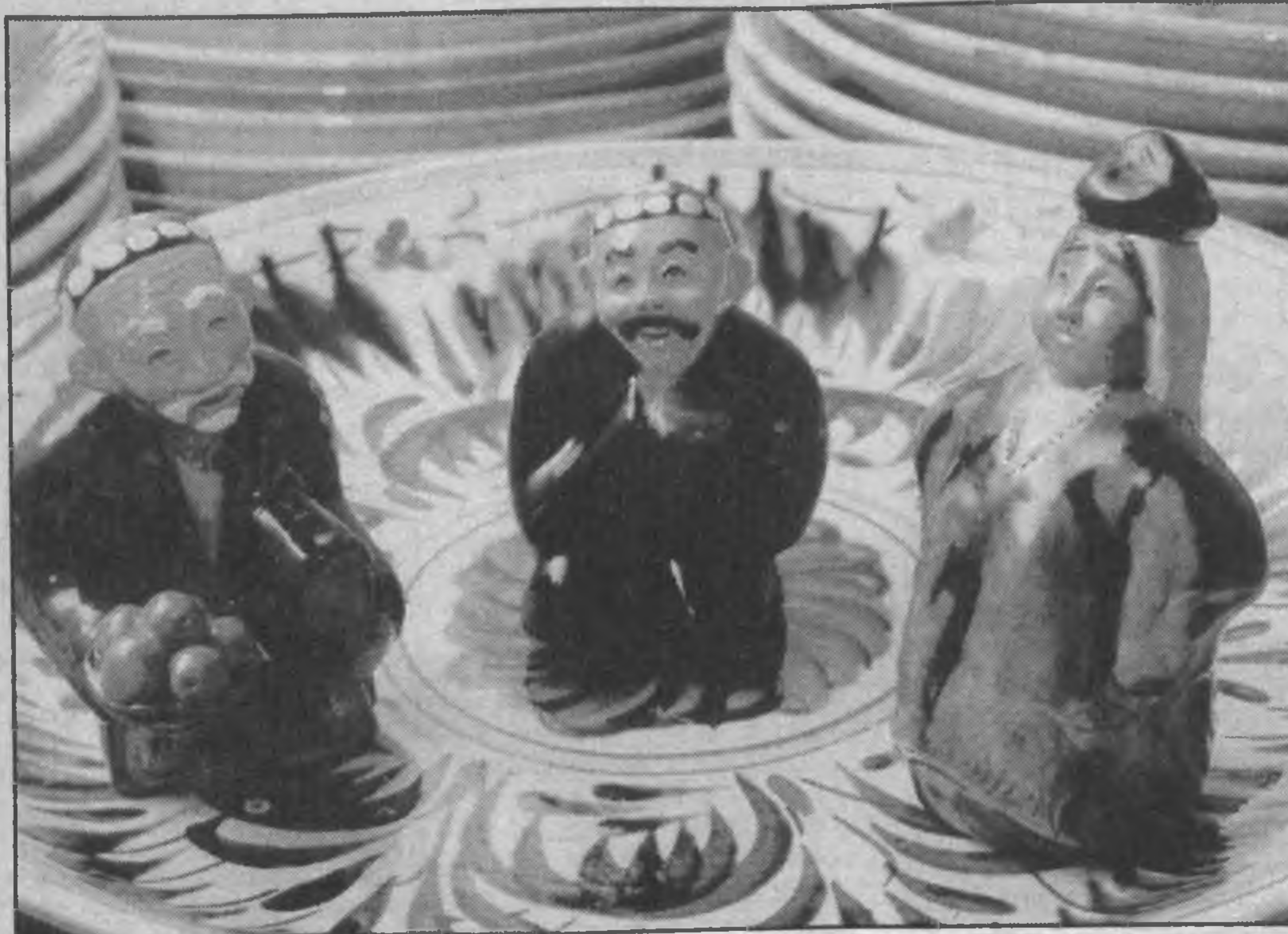
Когда, бываешь, мастеру-керамисту надоедает монотонная возня только с обычными ляганами или блюдами, в нем вдруг просыпается фантазия художника и в творческом порыве рождает изумительные народные образы.