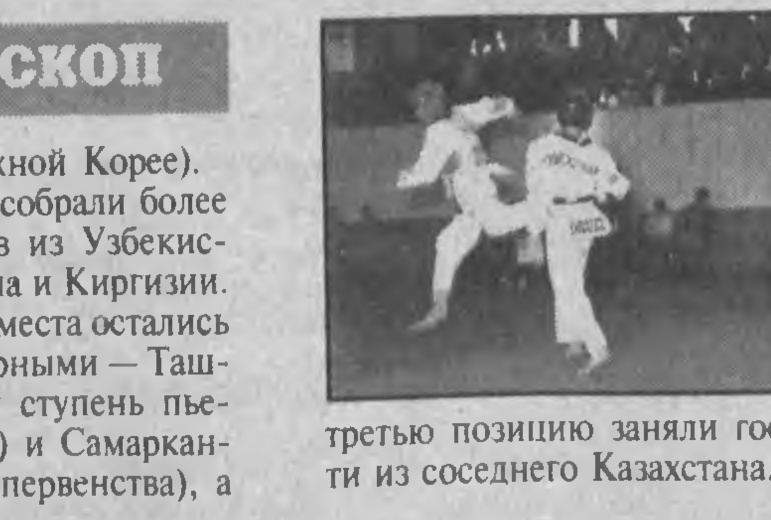
третью позицию заняли гости из соседнего Казахстана. НА СНИМКЕ: один из самых острых моментов турнира.

А особенно она стала значимой для ташкентского клуба "Алгоритм" и новоишского "Южанина", которые после второго этапа в Намангане, согласно добытым очкам, стали претендентами на первое место в чемпионате. Не остались в стороне и хозяйки турнира из "Талабы". Теперь они в конце апреля будут в Навои оспаривать право на бронзу, а оппонировать им будут волейболистки из ферганского "Егмоя". Кстати, на продолжение борьбы за третье место было сразу три претендента. Кроме обозначенных "Талабы" и "Егмоя", в числе конкурентов значились и спортсменки "Автомобилиста" из Ургенча. "Талаба" по сумме баллов проходила в плей-офф беспрепятственно, а "Егмоя" и "Автомобилист" все-таки создали интригу. В упорнейшей борьбе в 82 минуты за право играть в финальной части со счетом 3:1 (по партиям 25:20, 25:15, 23:25, 25:17) победу одержали ферганки.