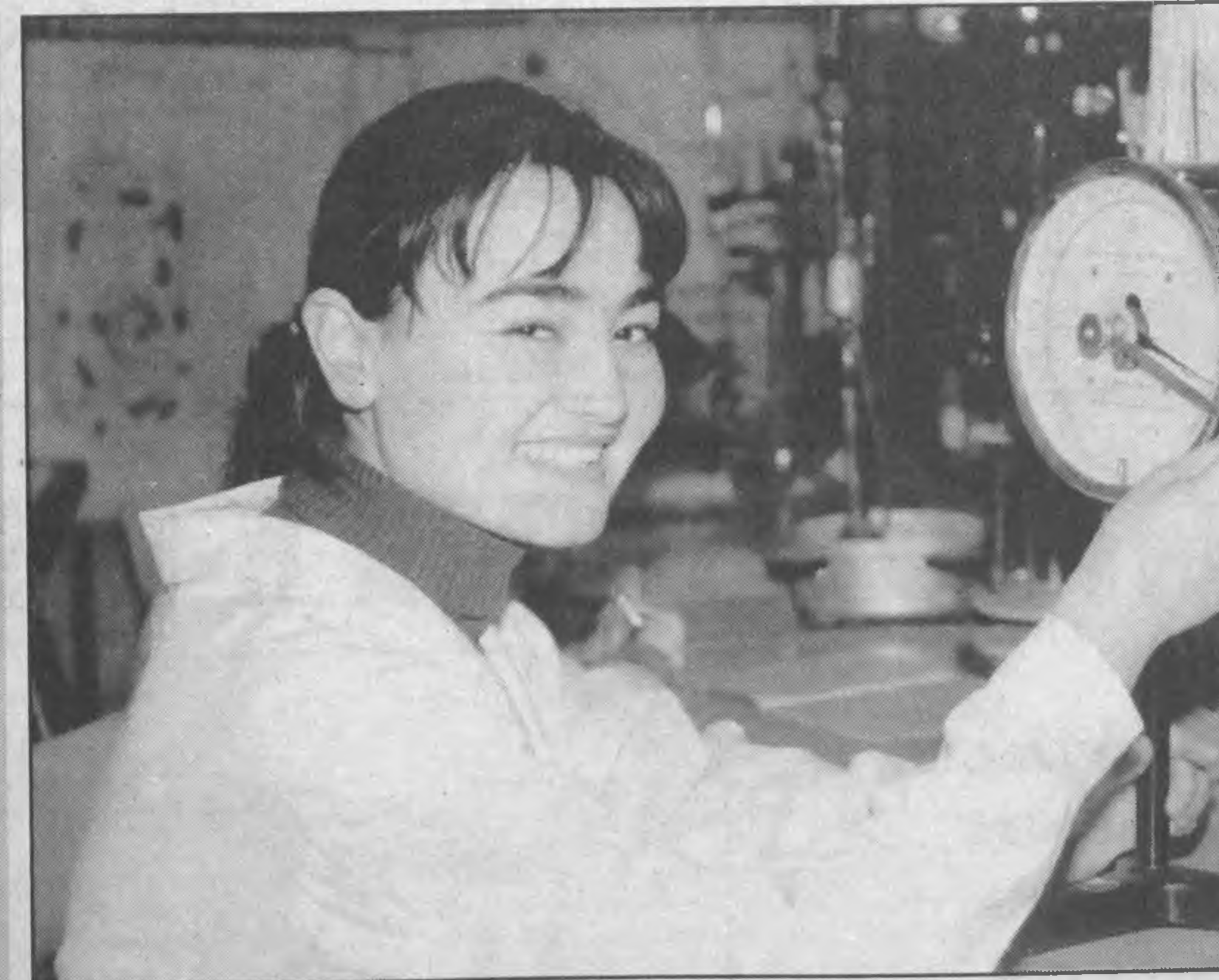
Кадры XXI века

Более того, как считают международные эксперты, вступление в силу закона обеспечит возрастание доверия иностранных инвесторов, что приведет к увеличению потока прямых зарубежных инвестиций в Узбекистан, расширит спектр банковских и финансовых услуг для широких слоев населения.