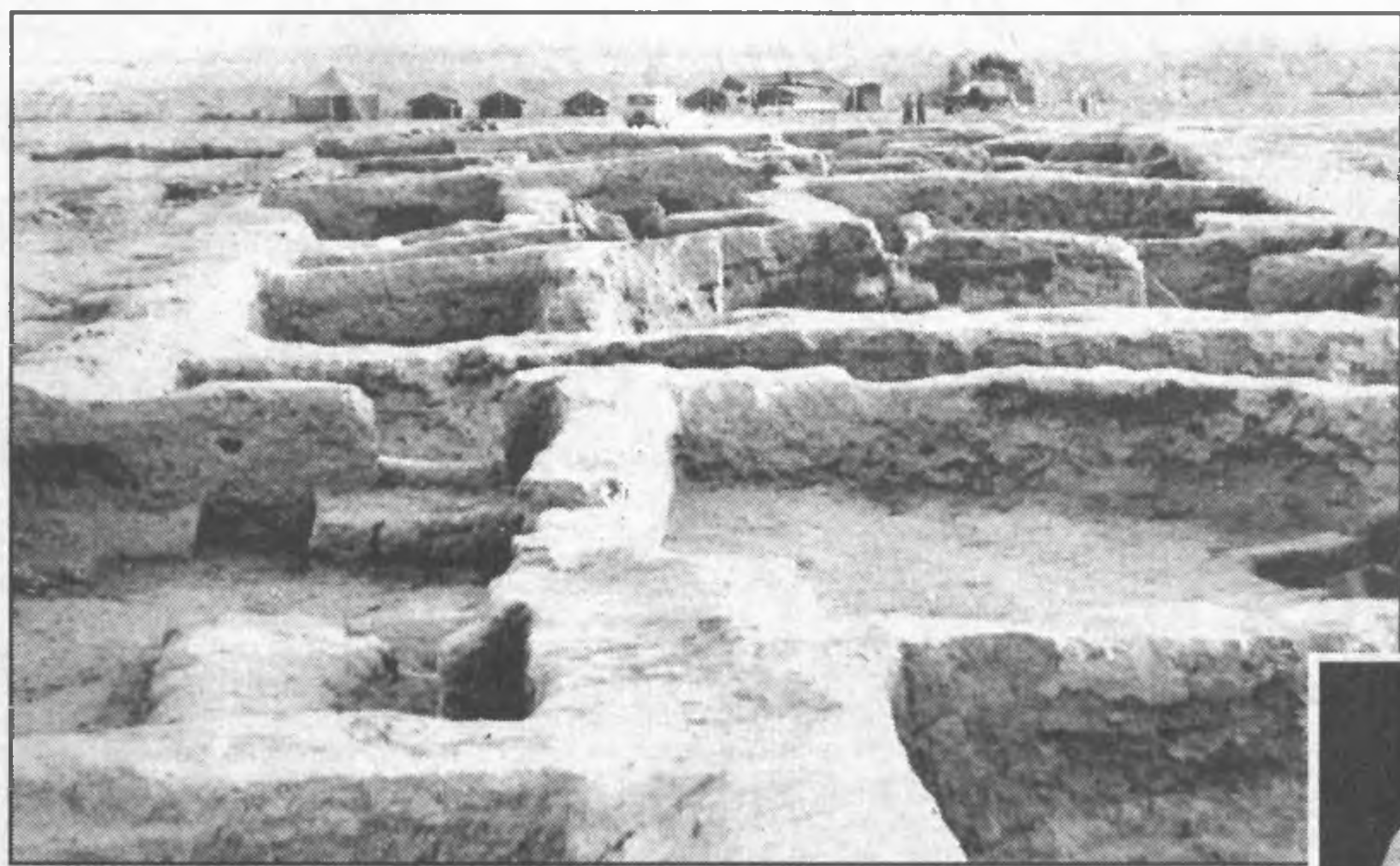
Джаннат ИСМАИЛОВА, доктор исторических наук. Лариса ЛЕВТЕЕВА, кандидат исторических наук.

Известно, что на территории современной Сурхандарьинской области образовались в эпоху бронзы первые центры земледельческого населения с развитым ремесленным производством. Эту хозяйственно-культурную форму существования человека характеризует изобретение гончарного круга и формирование высокой протогородской культуры. Классическими являются поселения городского типа Сапалиттепа (1750 — 1500 гг. до н.э.), Джаркутан (1500 — 1400 гг. до н.э.), Моллалиттепа и др. Наиболее богато в музее представлены материалы из Сапалиттепы. Это план реконструкции поселения, фотографии археологических раскопок, произведенных здесь экспедицией Института археологии Академии