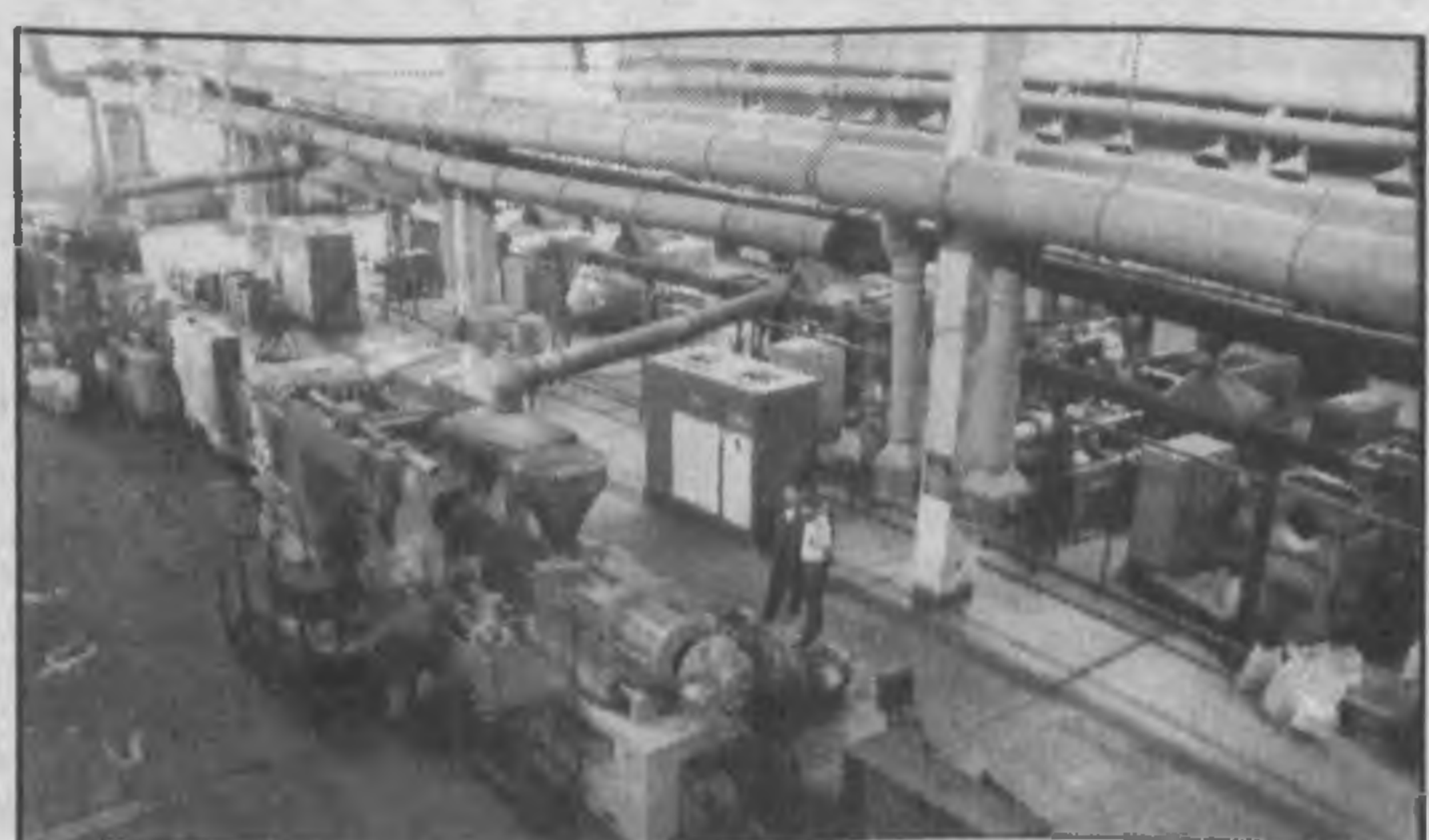
НА СНИМКАХ: машинист установки для отлива полиэтиленовых труб Кабул Каршиев; один из цехов предприятия.