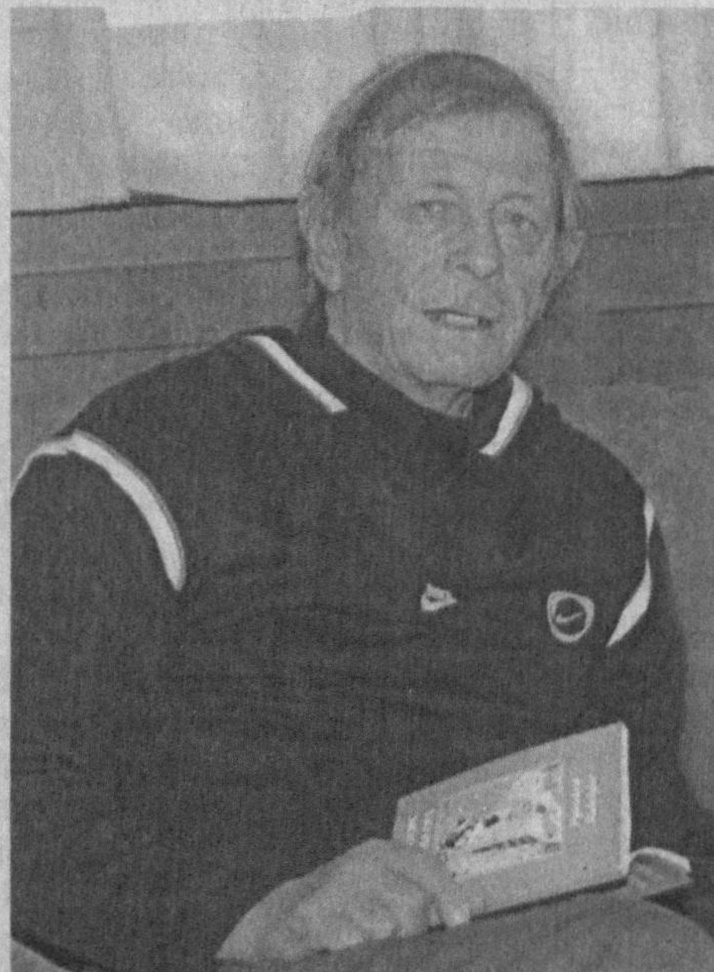
Олис-олиса бўлиб ром, Боқар денгизга беором. Том маънода Ишонч — соғинч, Соғинч-ла ишонч эрур том.